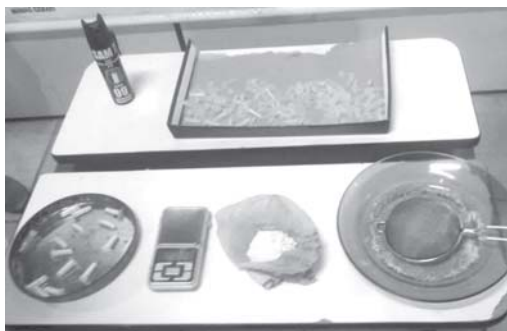
Objetos utilizados para manufaturar drogas foram recolhidos em duas residências

Um homem foi preso quarta-feira (5/4) por policiais civis em São Sebastião do Paraíso. Após receber informações de que o suspeito estaria traficando, investigadores passaram a monitorar o seu dia-a-dia. Abordado próximo ao Terminal Rodoviário os policiais localizaram 12 pinos plásticos contendo cocaína com ele.