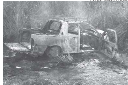
Apesar da gravidade do acidente, vítimas sofreram apenas ferimentos leves