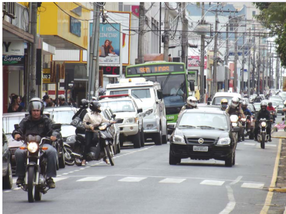
Vereadores admitem "medo" que mudança na fiscalização do trânsito da cidade se transforme em indústria de multas