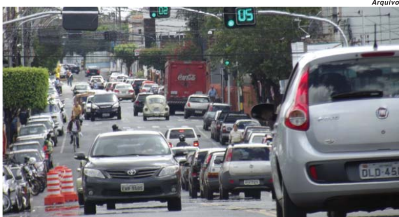
Vereadores admitem "medo" que mudança na fiscalização do trânsito da cidade se transforme em indústria de multas