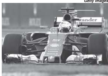
A Fórmula 1 torce para que o desempenho da Ferrari, na Austrália, se repita na China. Fará um bem enorme para o campeonato

A Ferrari conseguiu conservar os pneus melhor que a Mercedes na Austrália, o que foi determinante para a vitória de Vettel. Lewis Hamilton liderava a corrida, mas teve que antecipar a parada nos boxes enquanto o alemão permaneceu na pista por mais 6 voltas, e quando fez a troca de pneus voltou na frente do piloto da Mercedes.