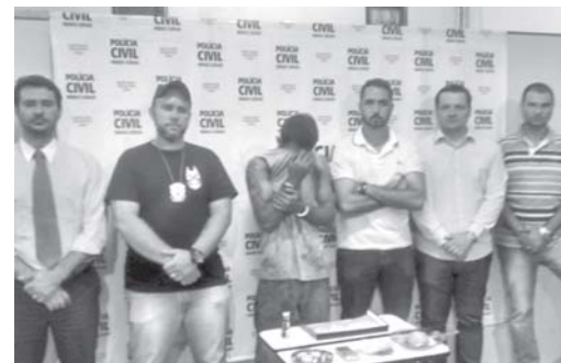
Policiais apresentam suspeito que foi preso em flagrante acusado de tráfico

Já durante as buscas na residência da mãe do suspeito, foram localizadas balança, pinos plásticos vazios, anotações típicas de contabilidade de tráfico de drogas, dois pinos plásticos com cocaína e outra porção maior da mesma substância enrolada em um pedaço de sacola plástica. O homem foi preso e autuado em flagrante delito por tráfico de drogas.