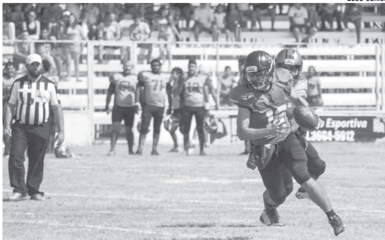
Time do Unimed Miners arranca na liderança da Conferência Triângulo

Após a partida contra o Cruzeiro em que o time de Paraíso saiu com derrota de campo a direção do Unimed Miners não desanimou. A aposta é de que o trabalho deve continuar com a mesma seriedade. "O Unimed Miners está entrando em uma nova