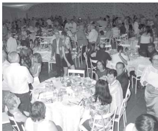
Convidados do Aquinenses Ausentes