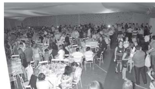
Convidados do Aquinenses Ausentes