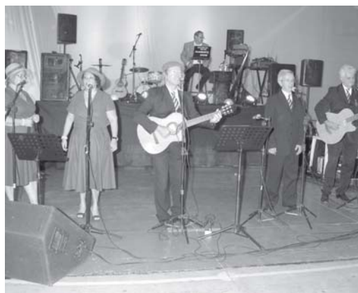
Paraíso em Seresta