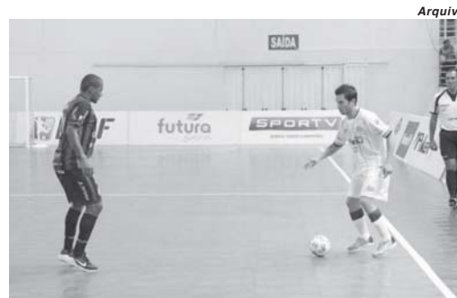
Em 2016 a equipe grená da Intelli goleou o Marreco Crescol por 7 a 0 na Arena Olímpica abrindo o campeonato nacional

A equipe da Intelli Paraíso Futsal tentará na próxima sexta-feira, 14, sua primeira vitória na disputa da LNF (Liga Nacional de Futsal) de 2017. O time enfrenta o Cresol Marreco, de Francisco Beltrão (PR) pela segunda rodada da competição. A partida é uma espécie de revanche, já que no ano passado na rodada inaugural da competição o time paranaense esteve em São Sebastião do Paraíso e sofreu uma goleada por 7 a 0.