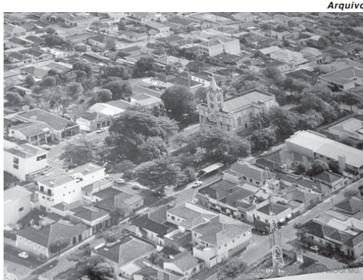
Comarca Itamogiense realiza cadastramento biométrico para novos eleitores, 13 já estão inscritos

Conforme informações obtidas pela reportagem junto ao Cartório Eleitoral da comarca