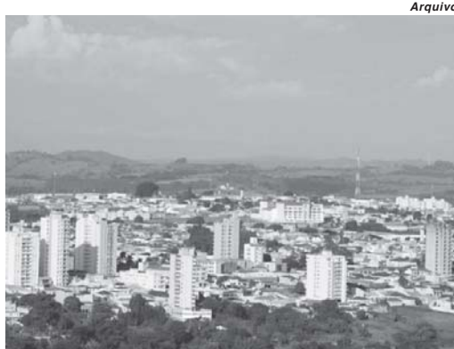
Município paraísense recebeu mais de um milhão de reais de FPM em valores brutos

Na região da AMEG (Associação dos Municípios da Região do Médio Rio Grande) compreendida por 21 municí-