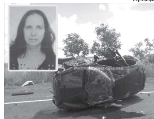
Acidente registrado no Alto Paranaíba vitimou mulher de Paraíso

Ainda no início do feriadão a Polícia Rodoviária de São Paulo registrou uma colisão