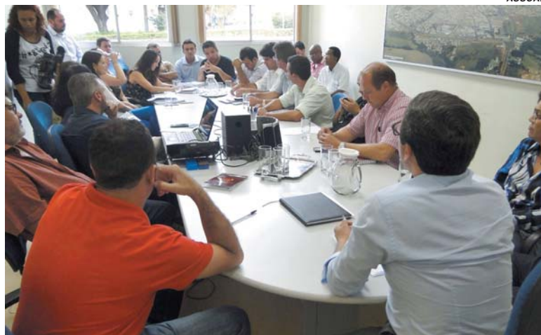
Prefeito reuniu vereadores e secretários para prestar conta das ações tomadas em 100 dias de administração