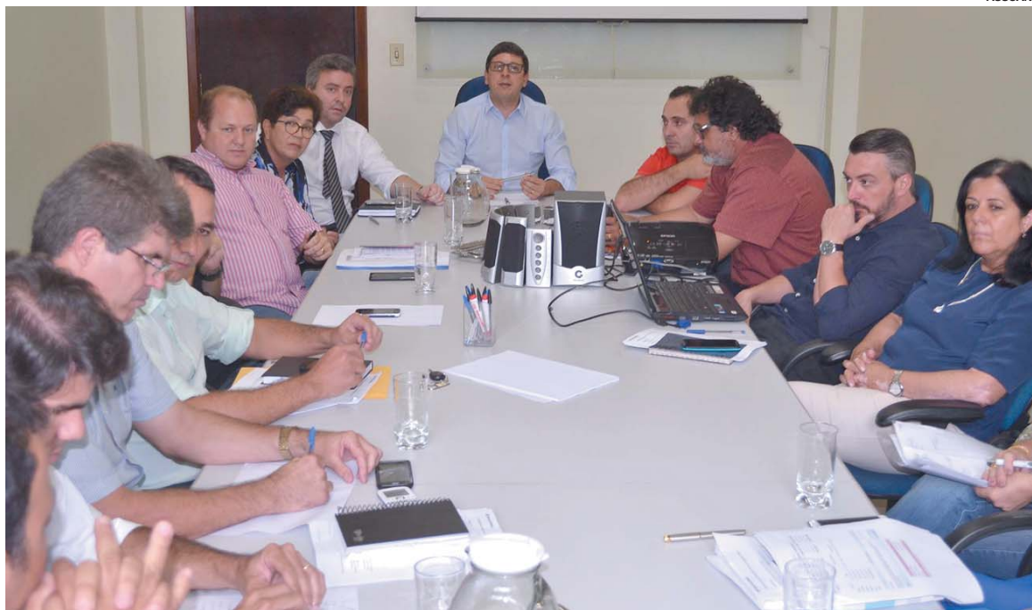
Prefeito reuniu vereadores e secretários para prestar conta das ações tomadas em 100 dias de administração

Comissão veta PL que cortaria fornecimento de refeições e lanches a servidores