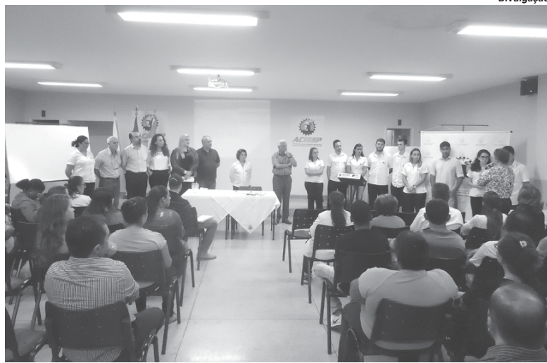
Representantes de diferentes segmentos participaram da reunião na Acissp

Ele ressaltou que no município foi realizado um levantamento abrangente que identi-