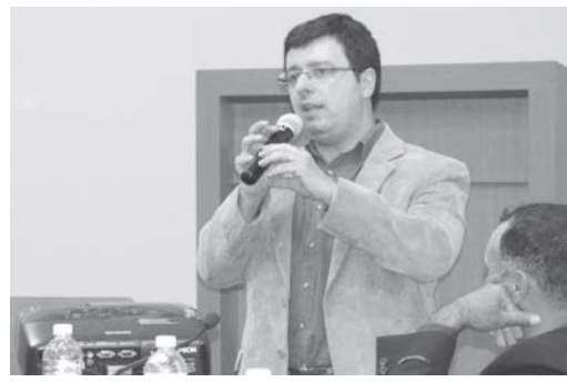
Professor apresenta projeto Educando Além da Vida

Conforme o professor, o objetivo final é mostrar para a sociedade que existe legislação específica que permite que o cidadão, ainda que por forma altruísta, possa fazer a doação do seu corpo para es-