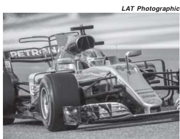
Mercedes tem 100% de aproveitamento no GP da Rússia

Depois de três GPs Sebastian Vettel (Ferrari) lidera o campeonato com 68 pontos de duas vitórias (Austrália e Bahrein) e um segundo lugar na China. Lewis Hamilton (Mercedes) é o vice-líder com 61 de uma vitória (China) e dois segundos lugares (Austrália e Bahrein). Atrás deles, um abismo separa seus companheiros de equipes: Valtteri Bottas (Mercedes) em 3º com 38 e Kimi Raikkonen (Ferrari) em 4º com 34. Coincidentemente dois finlandeses, ambos sob enorme pressão. Bottas por falhar na China quando rodou no asfalto úmido com o safety car na pista e por não converter a pole do Bahrein em vitória. Na corrida ainda teve que dar passagem duas vezes para Hamilton numa caçada a Vettel. E Raikkonen por sequer subir no pódio com um carro igual ao de Vettel.