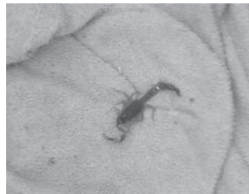
Escorpião foi encontrado em cima do pano de chão da Sra. Crislaine