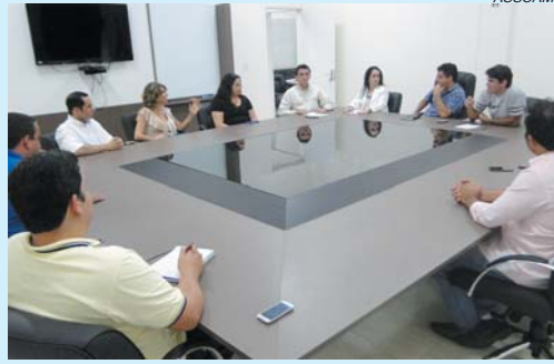
Vereadores se comprometeram a intervir caso não haja solução para os problemas alegados pelos médicos