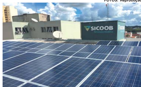
Agência Sicoob Nossocredito