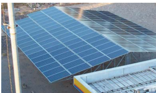
Posto de combustível - Recife/PE