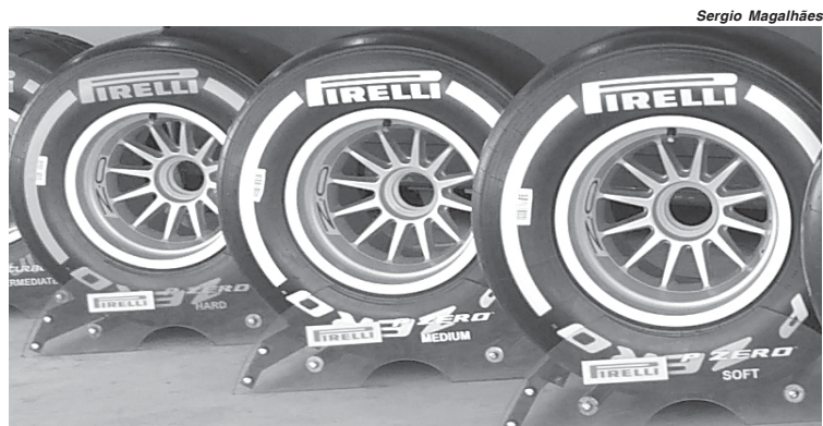
Os pneus médios e duros serão um grande desafio para os pilotos na Espanha

O GP da Espanha tem uma estatística pouco comum na Fórmula 1. Um desafio para Vettel, Hamilton, Raikkonen, Verstappen, Massa e Alonso de quebrar a sequência de dez anos seguidos que o vencedor não se repete no Circuito da Catalunha. Citei Massa e Alonso por fazerem parte da lista dos dez que venceram a prova nos últimos anos, mas em condições normais de corrida suas chances respectivamente com o FW40 da Williams, e o problemático MCL32 da McLaren são praticamente zero. Quem tem mais chances de quebrar esse tabu é Vettel e Hamilton, líder e vice-líder do campeonato, com Raikkonen e Verstappen correndo por fora.