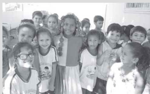
Boneca Reciclável no CMEI Orlando Soares Villas Boas

Separa, recicla Assim você preserva O nosso, o nosso, o nosso ambiente O lixo, o lixo, preciso separar Ai, eu separo, ai, eu separo Terça e sexta é o reciclável A galera começa a reciclar Segunda quarta quinta e sábado O rejeito vou descartar.