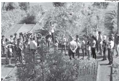
Estudantes participam de visita acompanhada pela Guarda Municipal no Parque da Serrinha