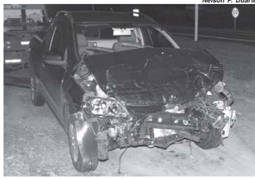
Na noite de domingo houve colisão envolvendo três veículos, condutor de uma Saveiro estaria alcoolizado