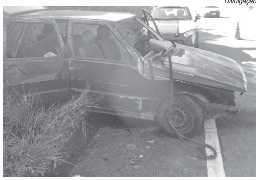
Na sábado, condutor perdeu o controle do veículo e colidiu contra um barranco na BR 265; uma pessoa morreu