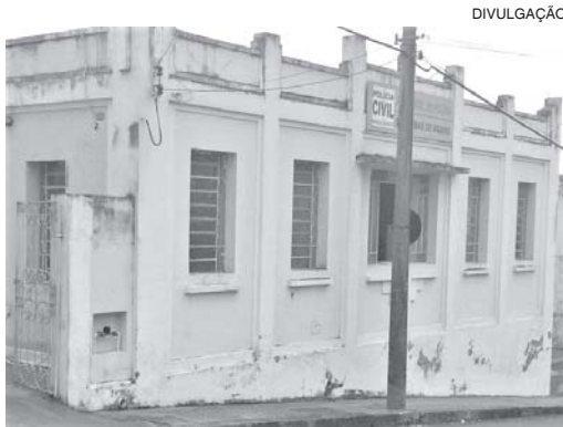
Prédio da Polícia Civil em São Tomás sofreu arrombamento na madrugada de domingo; nada foi levado

"Como um delegado irá trabalhar sem nenhum apoio? O delegado de São Tomás está trabalhando de pés e mãos atadas; é difícil investigar e para dizer bem a verdade, 99% dos crimes não têm solução. A região rural está em igual situação, sítios e fazendas têm sido alvo das ações desses ladrões. Precisamos melhorar a segurança pública aqui urgentemente e parece que a justiça ao invés de ajudar, tem é colocado