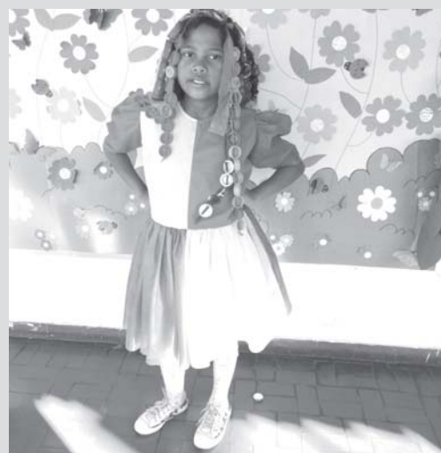
Boneca Reciclável Marcela Augusta