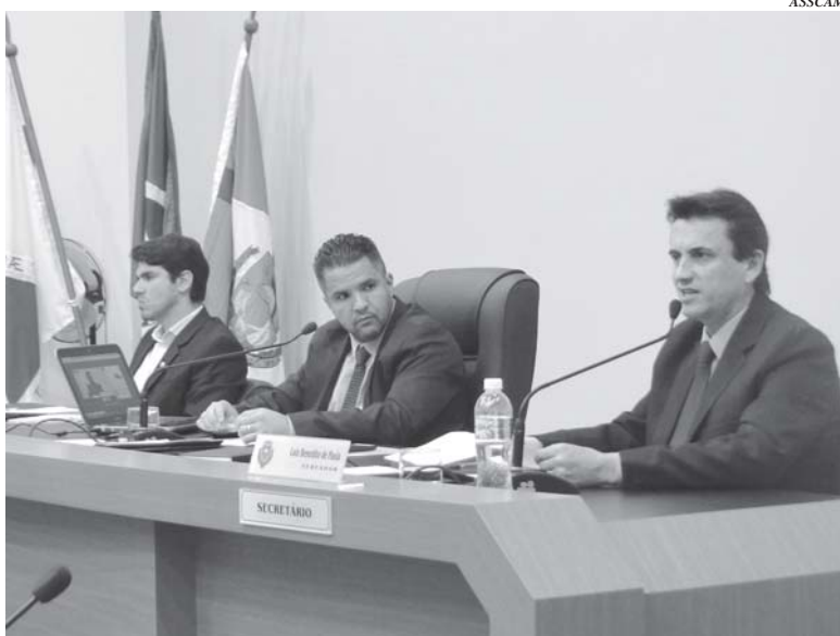
Vereadores fizeram cobranças em plenário, entre elas melhorias no trânsito, emissão de documentos e sinalização dos bairros

(PSDB), lembrou sobre a campanha Maio Amarelo e reforçou a população que respeite as normas de trânsito. "Eu trabalho na Santa Casa e tenho acompanhado muitas vítimas de acidentes de trânsito, gostaria de pedir à população que respeitem as normas de trânsito, que usem cinto de segurança e que os motociclistas façam as ultrapassagens adequadamente. Que tenhamos bas-