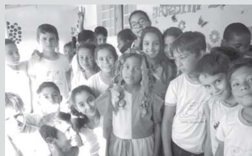
Boneca Reciclável na Escola Municipal Santo Tomás de Aquino