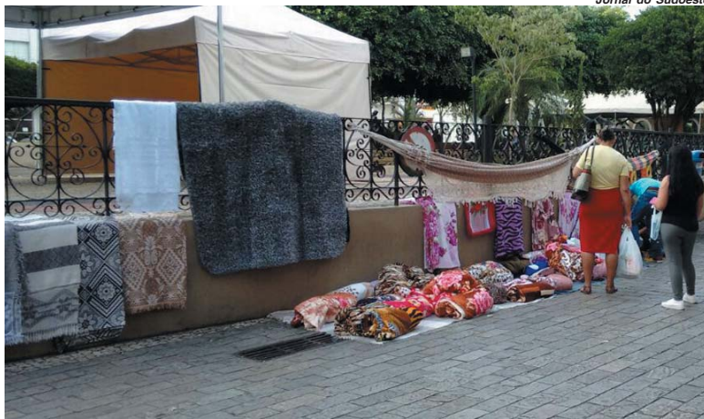
Fiscalização de comércio ambulante no Centro já foi questionada em outras reportagens; nenhuma providência foi tomada até agora

"Havia uma casa com mais de 100 anos de história, foi demolida e construída uma agência do banco Mercantil do Brasil, que não tem um espaço adequado para atender seus clientes. Aquele 'paredão' de motos impede que os idosos tenham fácil acesso ao banco e correm riscos ao tentar atravessar para chegar ao local. Quem tem moto, são pessoas