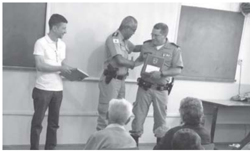
Estiveram no evento familiares e colegas de profissão dos homenageados