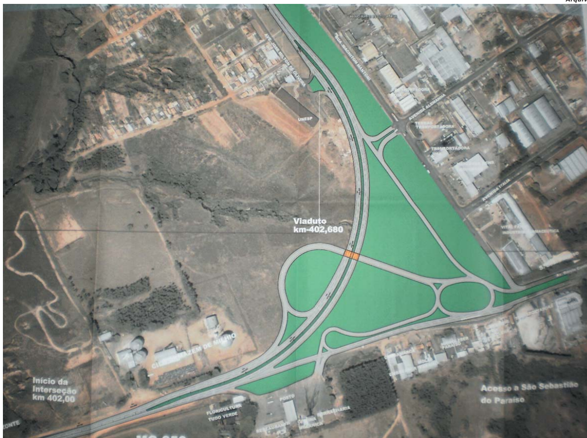
Promessa de construção de interseção entre a MG-050 e BR-491 deve ter início ainda neste ano