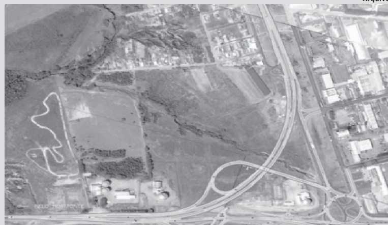
Projeto prevê a construção de um moderno complexo de interseção entre as duas rodovias

Na época conforme reportagens do Jornal do Sudoeste a Nascentes das Gerais informou que as obras foram paralisadas porque a Prefeitura de Paraíso não teria cedido um terreno ao Estado, mesmo ciente de que havia um acordo entre as partes para tal cessão. “A liberação da área necessária à execução da obra de nova interseção viária em dois níveis em São Sebastião do Paraíso é um assunto que tem sido tratado desde meados de 2010, com a prefeitura municipal”, anunciava a concessionária.