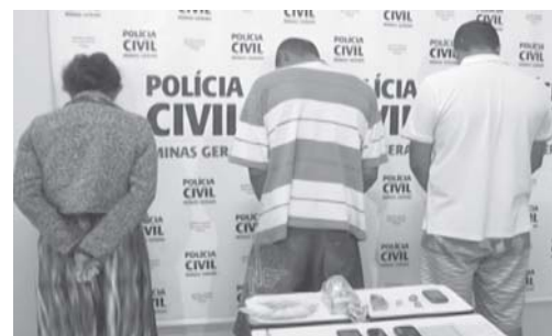
Cumprimento de mandado foi realizado no final da tarde de terça-feira

A polícia também realizou o cumprimento de mandado apreensão de um menor, localizado em Franca. D.M.M. seria suspeito de envolvimento em pelo menos oito roubos praticados nos últimos meses na região. "Ele atuava com