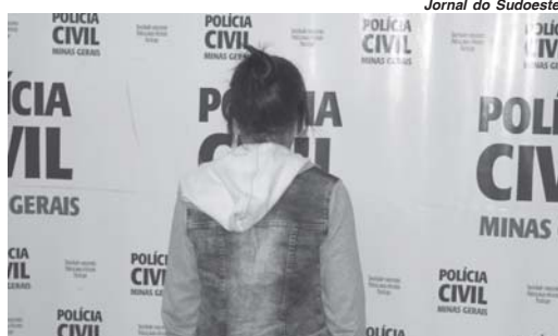
Mulher se apresentou junto com a advogada na quarta-feira e foi encaminhada ao presídio local