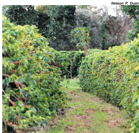
Nelson P. Duarte

No café robusta, a colheita alcança 45 por cento da safra, o que corresponde a um avanço de 10 pontos percentuais na