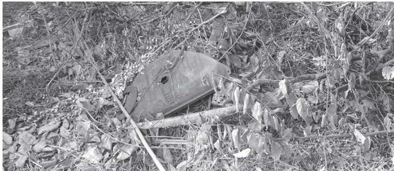
Quintal desta residência está com detritos que pode ser foco do Aedes Aegypti

Outro fato relatado por ele com o pedido de providências por parte do Departamento de Zoonoses, é que parte da calha da casa abandonada cedeu, e pode também ser foco, criadouro de mosquitos.