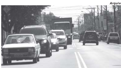
Quantidade de veículos vem crescendo no município e influencia na arrecadação de IPVA

Junto aos valores destinados às prefeituras uma parte do valor bruto é retirada e destinada ao Fundeb (Fundo de Desenvolvimento da Educação Básica). O valor líquido entra no caixa dos municípios podendo ser utilizado livremente para o pagamento de despesas de bens e serviços ou investimentos. No entanto, o valor do repasse é proporcional ao volume de