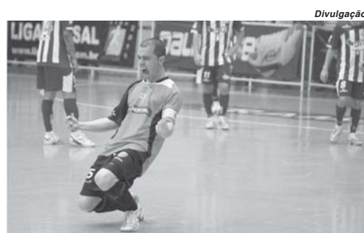
Com apoio da torcida ACBF virou em cima da Intelli Paraíso e avança na tabela de classificação

Ainda não foi desta vez que a Intelli Paraíso conseguiu se distanciar dos últimos lugares na classificação da Liga Nacional. O time que vinha numa crescente na competição tendo goleado o Copagrill por 7 a 1 e também vencido na Liga Paulista por goleada de 5 a 0 o Mogi das Cruzes, voltou a patinar na competição nacional. A equi-