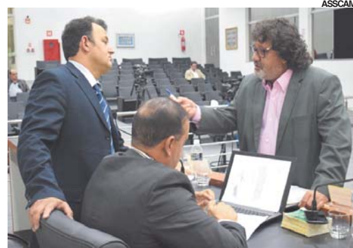
Sessão foi suspensa para análise de emenda de vereador ao projeto de doação de terreno ao Estado; projeto tinha caráter de urgência

Outro projeto que também foi aprovado e que havia causado polêmica em plenário foi o que autoriza o município a celebrar convênio de cooperação com o TJMG, colocando a disposição do Tribunal até quatro servidores. Também na úl-