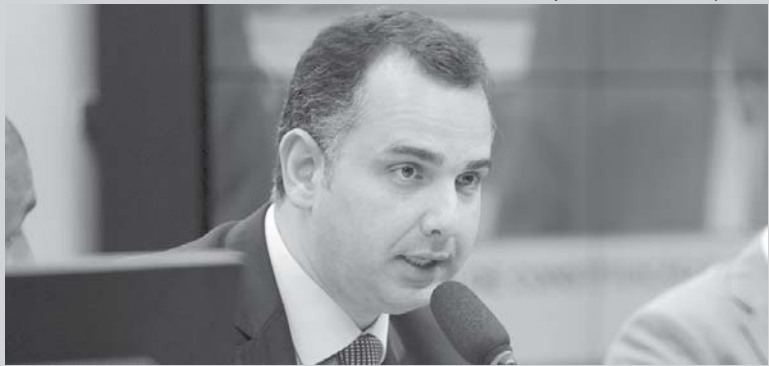
O deputado Rodrigo Pacheco (PMDB-MG) durante sessão da Comissão de Constituição e Justiça

O deputado Rodrigo Pacheco (PMDB-MG), preside na Câmara dos Deputados a Comissão de Constituição e Justiça (CCJ) que irá analisar denúncia apresentada pelo Ministério Público Federal, contra o presidente Michel Temer. Rodrigo Pacheco que tem ligações com São Sebastião do Paraíso e municípios da região, onde foi votado, adiantou que não aceitará "interferência" do governo. Caberá a ele a escolha de um relator para o caso, e conforme disse, será feita assim que a denúncia for apresentada à Comissão.