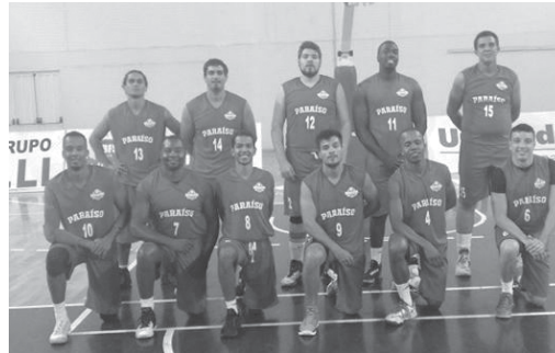
Equipe de Paraíso chega a primeira final após o retorno às quadras do time adulto