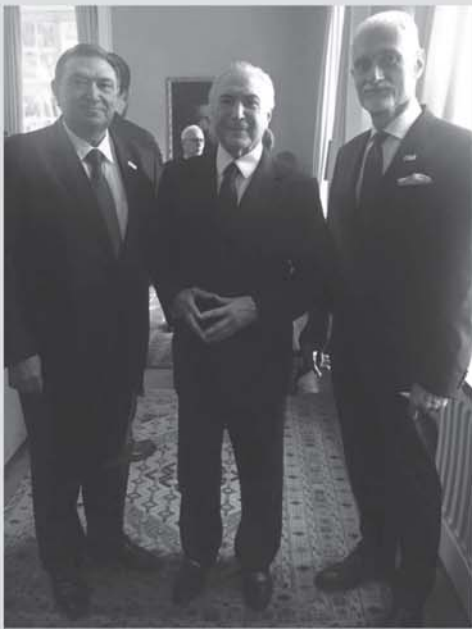
Durante jantar na Embaixada do Brasil em Oslo, o deputado Átila Lins, o presidente Michel Temer e o nosso embaixador na Noruega, George Prata, se encontraram com empresários noruegueses para falar sobre as oportunidades e tentar ampliar o número de empresas que investem no Brasil

Vejam como são as coisas: A poderosa JBS, de Joesley Batista, entrou em marcha à ré no mercado internacional. Depois de receber mais de R$ 10 bilhões do Governo Lula, via BNDES, a JBS pediu mais R$ 1,5 bilhão no Governo Dilma para a compra do frigorífico irlandês Mafrig, que marcaria a presença da JBS na Europa. Mas, com o veto recente do BNDES, faltou dinheiro para a internacionalização e começa a faltar dinheiro para outras operações. Podem prestar a atenção: agora o apoio da Globo à JBS também vai entrar em marcha à ré.