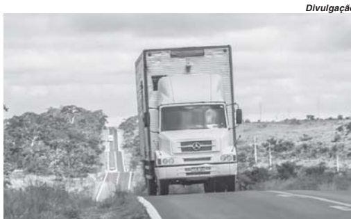
Quem for pego descumprindo a norma estabelecida ficará sujeito a aplicação de multa superior a mais de mil Reais

Mais de um milhão de veículos da frota nacional ainda