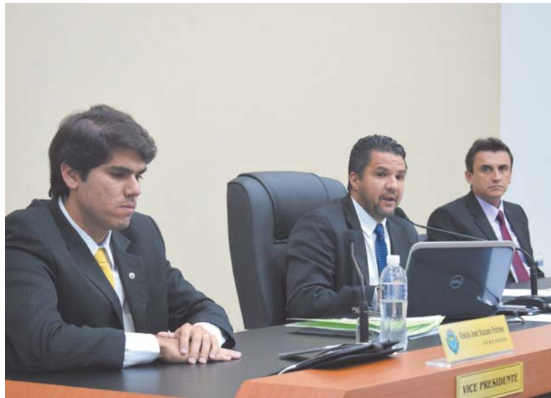
Vereador questiona advertência ao condutor de veículo da saúde envolvido em acidente