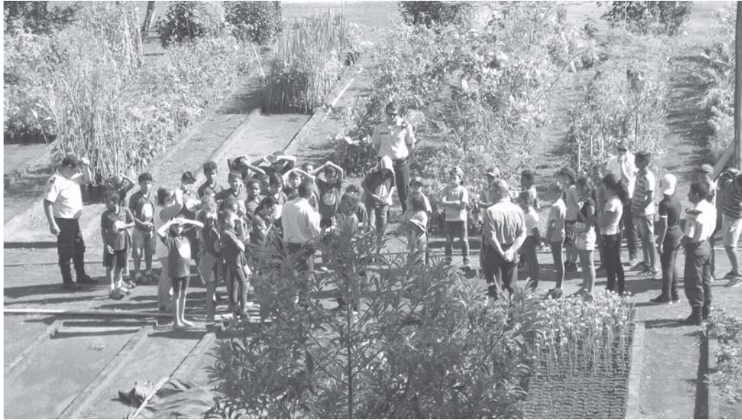
Algumas escolas de Paraíso já realizam atividades em tempo integral

Até 2014 Minas Gerais não possuía uma política ampla de Educação Integral. Segundo especialistas a oferta era oscilante e sem proposta de ampliação; a ênfase estava no reforço escolar, na avaliação externa e na oferta de macrocampos do programa Mais Educação. Com a criação das escolas POLEM, além de abrir caminhos para a Educação Integral e Integrada, está sendo assegurado acesso e a permanência dos educandos na educação básica. A intenção é a de garantir a efetiva aprendizagem,