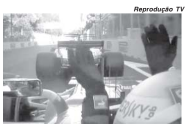
Momento em que Vettel bate involuntariamente na traseira de Hamilton e depois revida, aí sim, batendo de propósito no adversário

E vale lembrar ainda que antes do ocorrido, Hamilton reclamava pelo rádio que a lentidão do Safety Car – por causa das características do Circuito de rua de Baku não ser favorável para que o carro de segurança an-