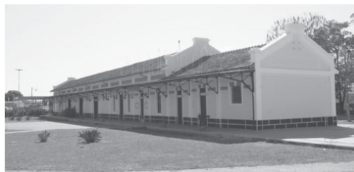
Circulação de trens foi desativada em Paraíso e região no final dos anos 80