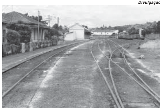
Estação de trem da Mogiana foi transformada em Casa da Cultura em São Sebastião do Paraíso

O parlamentar chegou a fazer indicação de recursos para esta finalidade, acreditando no projeto que beneficiaria toda a região. “Há quatro anos fizemos a indicação de uma verba de R$ 100 mil para a elabora-