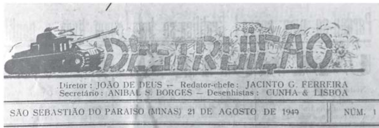
Destruição. São Sebastião do Paraíso, 21 de agosto de 1949.