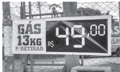
R$ 49,00, o preço mais barato do gás de 13kg em Paraíso

nesta quinta-feira (6/7) pequeno levantamento de preços em alguns estabelecimentos. Levantamento completo será feito na próxima semana, para dar