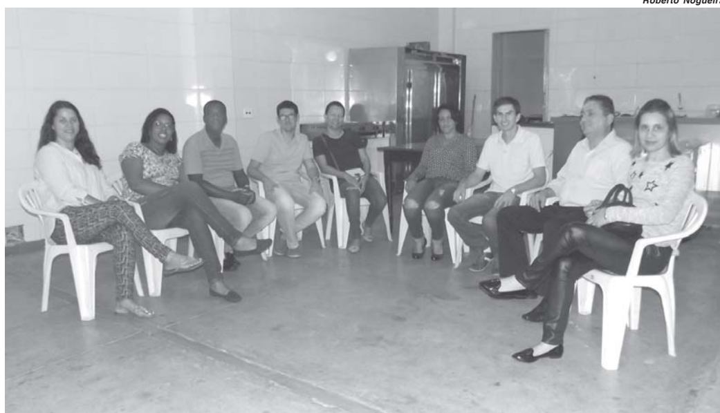
Grupo de voluntários se reúne mensalmente para tratar do tema adoção com troca de informações e atividades de convivência

A criação do grupo tem como objetivo organizar os encontros e apoiar os pretendentes a pais por adoção, que estão cadastrados na Vara da Infância e Juventude do municí-