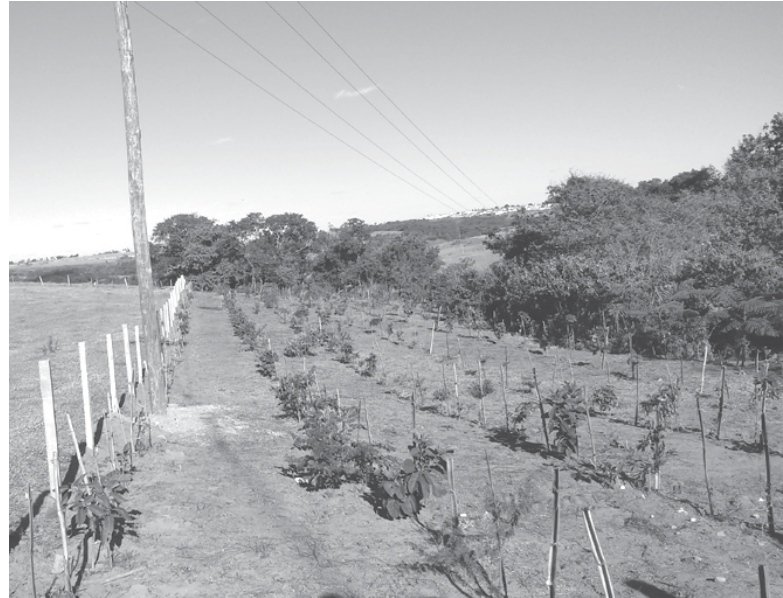
Reflorestamento plantado debaixo da rede de alta tensão

No local onde as árvores foram plantadas existem tam-