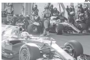
Com os acontecimentos da corrida passada à flor da pele, ainda há acertos de conta na Fórmula 1

Outra briga que merece atenção é a dos pilotos da Force India, Sergio Pérez e Esteban Ocon. No Canadá Pérez se recusou obedecer a uma ordem de equipe para dar passagem ao companheiro de equipe que dispunha de mais velocidade e condições