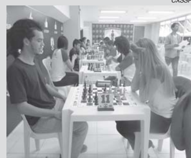
Clube de Xadrez de São Sebastião do Paraíso promove dois torneios valendo pontos para o ranking internacional

Branças: Gilles Andruet Pretas: Boris Spassky França, 1988 1.d4 Cf6 2.c4 e6 3.Cf3 Bb4+ 4.Bd2 Bxd2+ 5.Dxd2 d5 6.Cc3 0-0 7.e3 Dd7 8.Tc1 Td8 9.Dc2 Cbd7 10.cxd5 exd5