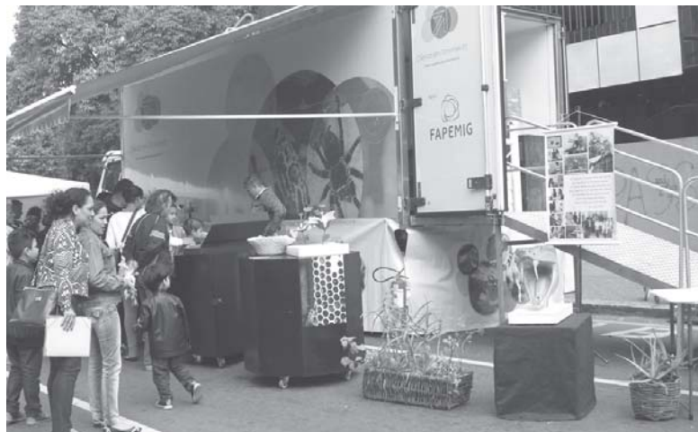
Programa criado em 2012 tem o objetivo de oferecer conhecimento para estudantes e a comunidade em geral

O Programa Ciência em Movimento, da Funed (Fundação Ezequiel Dias) vai levar conhecimento científico e informações para os municípios de Minas Gerais por meio de um caminhão itinerante. São Sebastião do Paraíso está entre as cidades que vão receber o projeto que há mais de seis anos percorre o interior levando conhecimento sobre vários assuntos ligados a saúde.