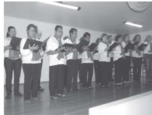
Momento Cultural, Coral Renascer