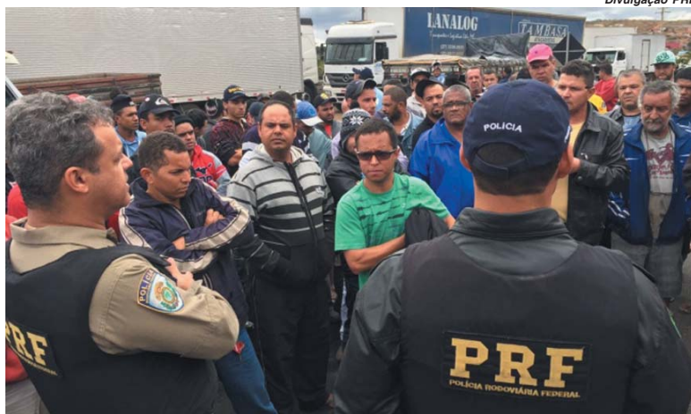
Em João Monlevade, caminhoneiros negociaram com agentes da PRF

Em João Monlevade, segundo a Polícia Rodoviária Federal estava liberada a passagem de carros e ônibus. Em Divinópolis, apesar do trânsito lento, não havia bloqueio.