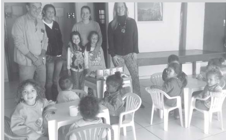
Contadores de São Sebastião do Paraíso e Região, doaram leite em pó para o Lar Menino Jesus que abriga 20 crianças com idade entre 1 a 4 anos. O evento foi realizado em julho no salão da CEDUC.