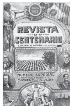
Antonio Carlos Ribeiro de Andrade à Assembleia

Legislativa Mineira, em 1 de agosto de 1929, consta que estava sendo construído o prédio para abrigar o Grupo Escolar de São Tomás de Aquino.