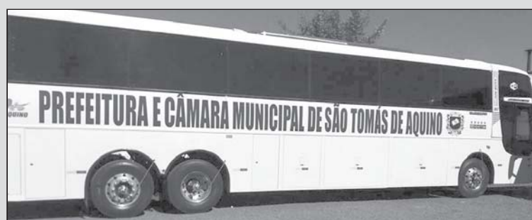
Ônibus adquirido com recursos próprios. Parceria da Prefeitura e Câmara

Prefeitura e Câmara Municipal adquirem ônibus de 50 lugares com recursos próprios. Uma parceria valiosa com os vereadores. Veio em boa hora para o transporte de universitários e transportes diversos, atendendo a demanda do município.