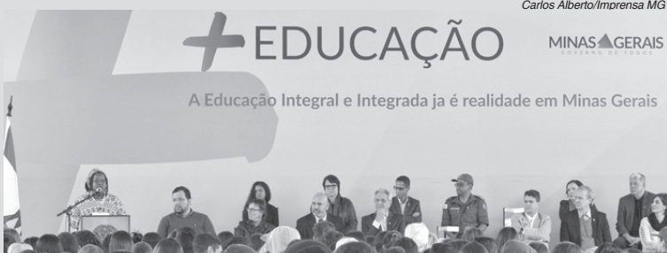
A secretária de Estado de Educação, Macaé Evaristo, lançou o programa em uma escola de Brumadinho

O Governo de Minas Gerais lançou nesta terça-feira (1º/8) na Escola Estadual Paulina Aluotto Ferreira, em Brumadinho, Território Metropolitano, o programa "+ Educação", iniciativa para integrar e melhorar a educação em todos os territórios de desenvolvimento do estado.