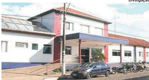
Asilo São Vicente Paulo de Paraíso está entre as entidades beneficiadas

O Programa promove a inclusão social, da cidadania e dos direitos. A iniciativa visa incentivar nas áreas dos municípios onde Furnas possui suas instalações projetos que tem por objetivo melhorar o padrão e a qualidade de vida das pessoas assistidas. Para tanto os candidatos devem estar inseridos nas áreas onde Furnas possui um ponto de atendimento como usinas, reservatórios e bacias hidrográficas correspondentes, subestações, escritórios e linhas de transmissão. Também estão inseridos os locais onde a empresa tenha con-