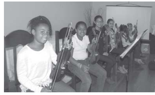
Para apresentação cultural alunas de violino da Unidos Venceremos

A VII Conferência Municipal de Assistência Social de São Tomás de Aquino, teve como tema "Garantia de Direitos no Fortalecimento do SUAS". O evento aconteceu no salão nobre da Escola Municipal Santo Tomás de Aquino.