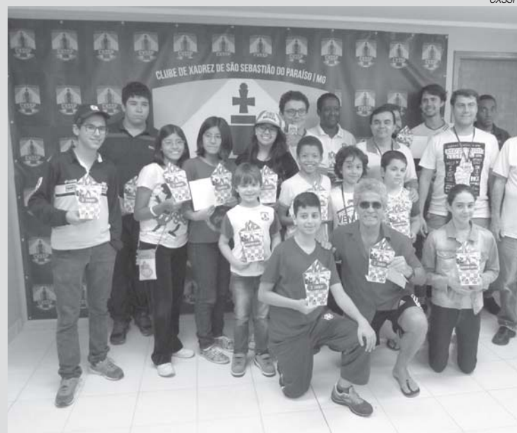
CXSSP realizou mais um Torneio de Férias

Chegou ao fim a segunda edição do nosso Torneio de Férias.