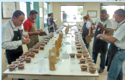
Amostras serão analisadas por uma equipe de fiscais que avaliará os melhores produtos selecionados

A comissão julgadora é composta de, no mínimo 10 classificadores e degustadores de café, devidamente