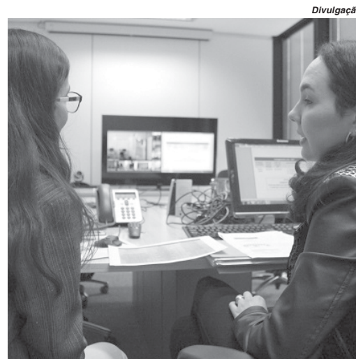
A oferta abrangerá 16 SREs, com 50 vagas cada uma, e as inscrições vão até o final de agosto

As inscrições podem ser feitas até o final do mês sendo que a previsão é de que o curso de formação tenha início em 2 de outubro. Participarão deste projeto 13 regionais de ensino, incluindo a de São Sebastião do Paraíso que é responsável pelo atendimento em 16 municí-