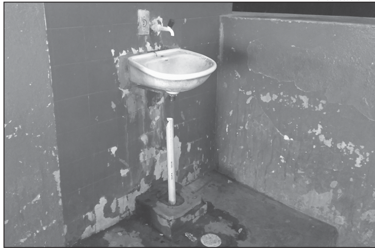
Espaços estão bastante deteriorados; investimento para recuperação deve ser grande

Apesar da boa vontade do novo presidente, que tem literalmente colocado mãos na massa para tentar dar uma cara nova à Praça de Esportes Castelo Branco, os diálogos em relação à encampação do espa-