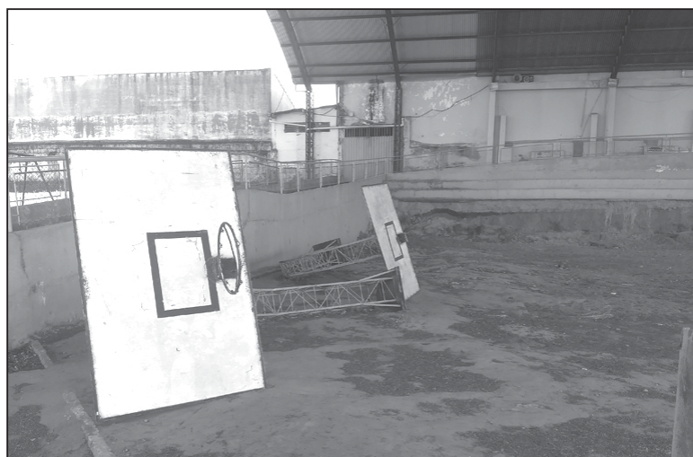
Investimento em nova quadra seria mais R$ 300 mil, obra nunca foi concluída