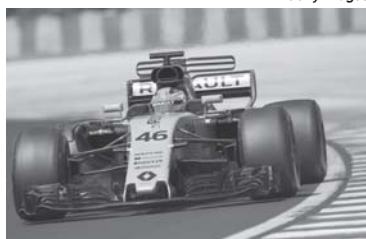
Robert Kubica pode estar a um passo de voltar à F1, seis anos depois do grave acidente de rali

O GP da Hungria foi um verdadeiro jogo de equipe. De um lado Lewis Hamilton solicitando que a Mercedes pedisse para Valtteri Bottas lhe ceder a 3ª posição para poder atacar as Ferrari. Depois da janela de pit stop, Hamilton tinha mais ritmo de corrida e condições de lutar pela vitória já que Vettel enfrentava problemas com o volante do carro. De outro lado, Kimi Raikkonen (2º) tentava convencer a Ferrari de que era preciso ultrapassar Vettel para não correr o risco de serem engolidos pelas Mercedes. Toto Wolff decidiu apostar em Hamilton e garantiu que Bottas teria a posição de volta caso o companheiro de equipe não obtivesse sucesso. Já a Ferrari se manteve fiel a sua velha e conhecida filosofia de jogar tudo em favor do piloto que ela determina para lutar pelo título, no caso, Vettel. E assim foi a segunda metade da corrida, cercada de suspense e de longas conversas que mais parecia uma conferência entre pilotos e engenheiros via rádio.