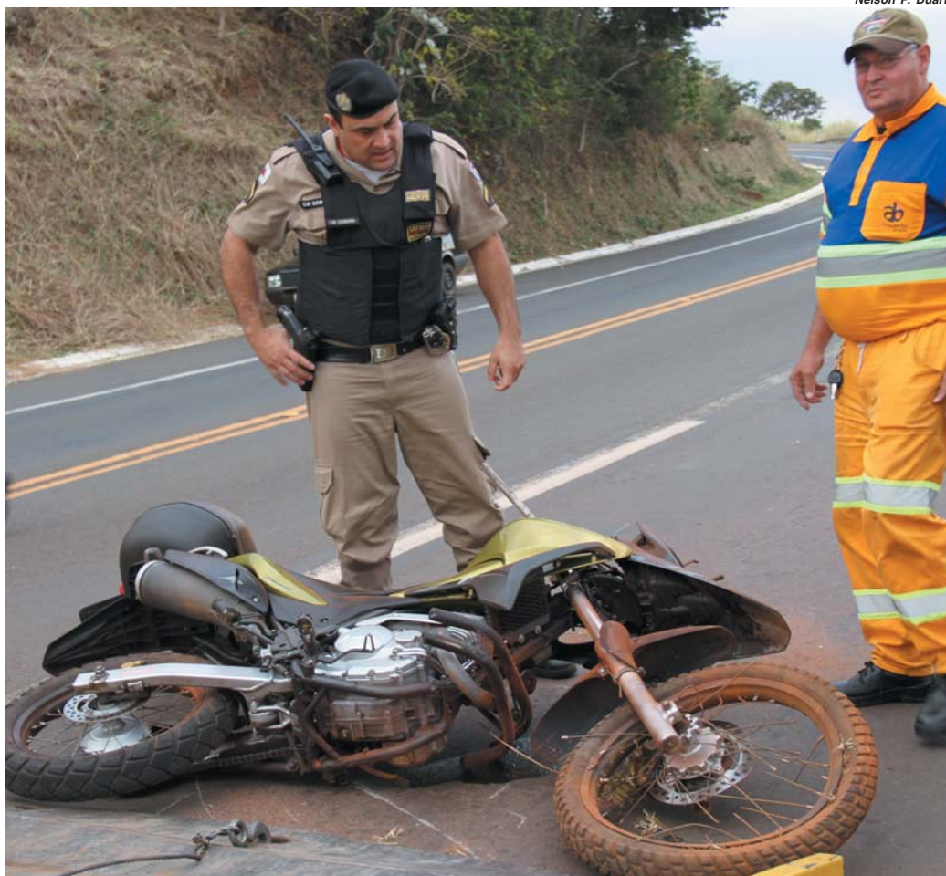
Acidente ocorreu na BR 265 no município de São Sebastião do Paraíso na tarde de quinta-feira

Novo presidente da Praça de Esportes sonha com recuperação do espaço