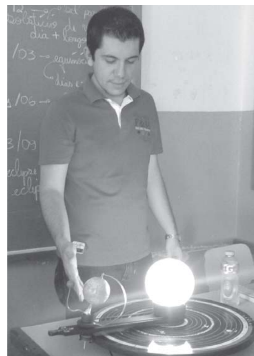
Aula prática das estações do ano