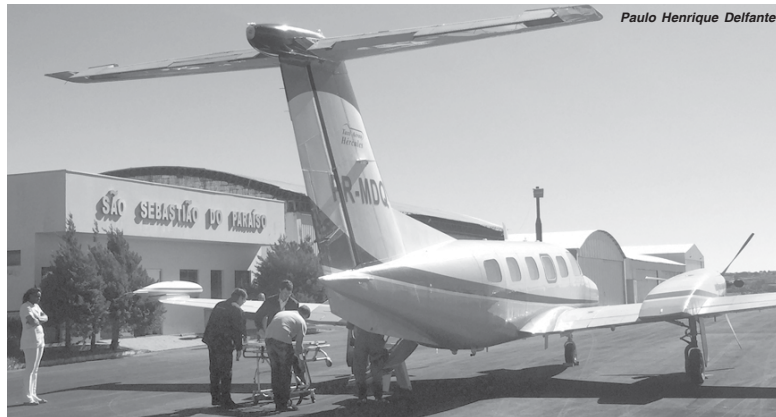
Jovem estava internado na Santa Casa e foi transferido para atendimento especializado para Belo Horizonte

Transporte foi feito de avião; informações extraoficiais dão conta de que seu quadro de saúde é estável