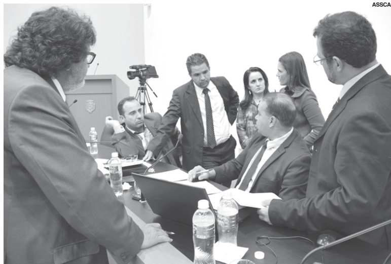
Reunião foi suspensa para análise e parecer favorável de projetos pela Comissão de Finanças