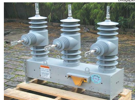
Equipamentos estão sendo instalados na zona rural de vários municípios da região