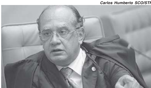
Ministro Gilmar Mendes (STF)

“Ele não tem preparo jurídico nem emocional para