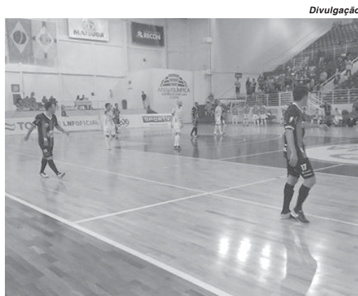
Na Arena Intelli supera o lanterna Guarapuava em jogo disputado com muitas emoções

No entanto, os adversários reagiram e foram buscar o empate por 3 a 3. Os visitantes equilibraram as ações e tiveram maior posse de bola. Classificados entre os últimos colocados o quinteto de Guarapuava