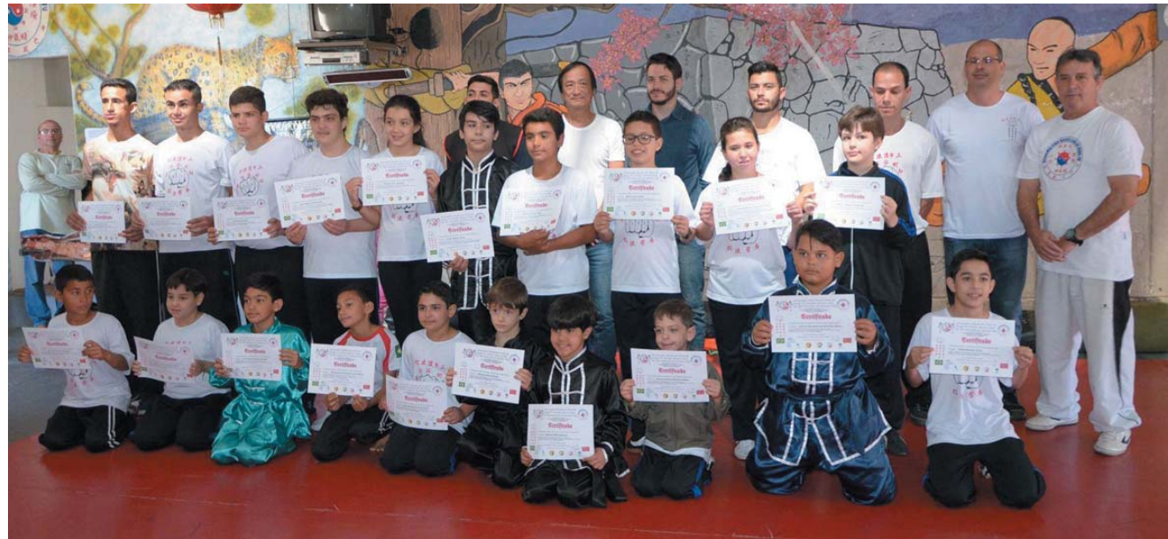
As crianças receberam um certificado após serem aprovadas em avaliação

Ainda, segundo o professor, o trabalho foi muito produtivo. "É sinal de que estamos fazendo um bom trabalho em encaminhar essas crianças para o bem. Além do exame, essas crianças também têm que apresentar as notas da escola, e temos per-