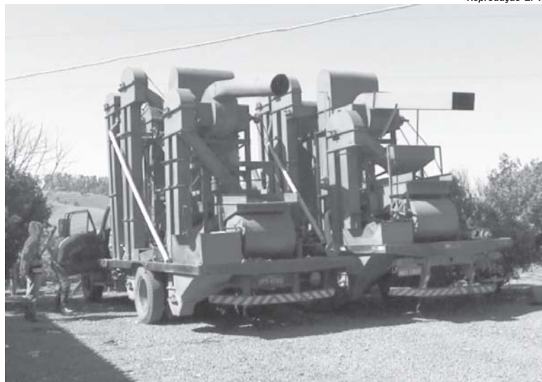
Criminosos adulteravam máquinas de lavagem de café para furtar os grãos

“O restante das pessoas que trabalhavam e prestavam serviços para esses criminosos, não conseguimos identificar. Não há qualquer vestígio, nomes ou qualquer informação que possa ajudar nessa identificação, mas os proprietários dessas máquinas e caminhões foram identificados e não vão voltar lesar nenhum outro produtor”, completou o delegado.