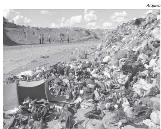
Através de consórcio aterro sanitário receberá rejeitos da região e município será compensado financeiramente

O município já aprovou uma legislação própria priorizando o apoio institucional e o acesso aos recursos financeiros. O Consórcio Intermunicipal para o Desenvolvimento Sustentável de Paraíso e região executará as tarefas de plane-