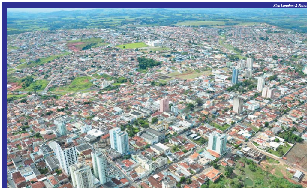
Xico Lanches & Fotos

Projeto do Orçamento Municipal 2018 será enviado ao Legislativo até amanhã