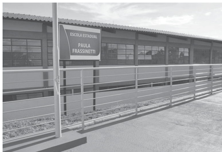
Escola foi inaugurada em 2011 em parceria entre Estado e Município

O edital foi lançado no dia 10 de julho e o resultado da seleção das escolas foi anunciado no dia 11 de agosto. Já a seleção final foi anunciada na quinta-feira, 24.