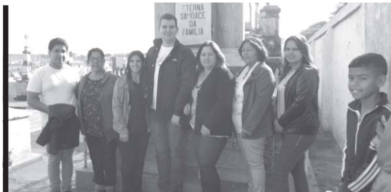
Educadores em visita ao cemitério

não está mais aqui, mas que construíram a bela história de São Tomás de Aquino com honra, trabalho e muito idealismo. Motivo de orgulho de todos os filhos da terra, os aquinenses.