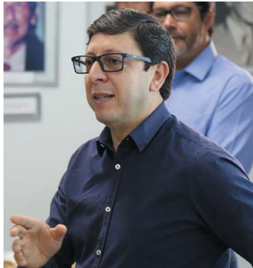
Prefeito e Interventor da Santa Casa falam sobre importância de 'abraçar' a causa do Hospital