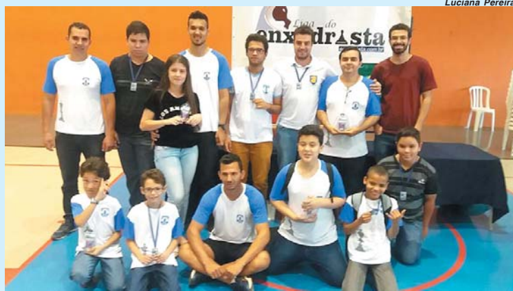
Equipe do Clube de Xadrez de São Sebastião do Paraíso que disputou a Liga do Enxadrista no SESI de Franca