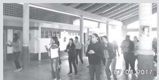
Momento de recreação-ginástica