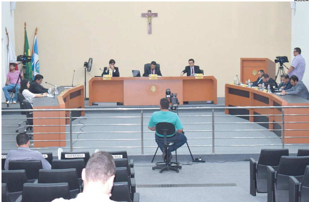
Projetos vinham se arrastando na Câmara há bastante tempo, mas tiveram conclusão em última sessão

O outro projeto, sobre vale-alimentação, vereadores e sindicato chegaram a comum acordo que resultou no arquivamento por unanimidade da proposta. Conforme já havia explicado o presidente, o entendimento dos vereadores e do Sempre é que a Lei Orgânica já garantiria o benefício para funcionários afastados por motivo de doença.