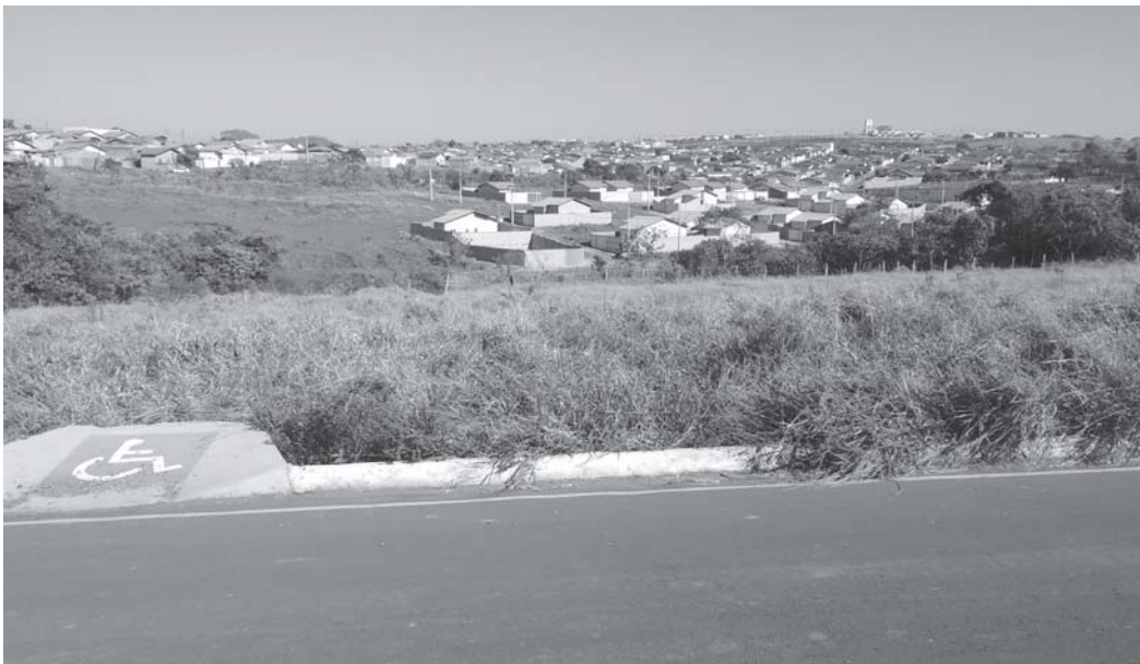
Local adequado para construir uma ponte para ligar o bairro da Zona Leste, nordeste e norte de Paraíso