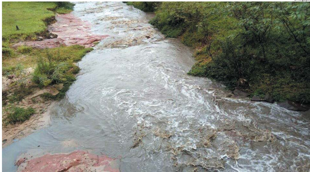
Poluição a recursos hídricos foi o mote que levou o vereador a ingressar com ação contra a empresa. Há dois anos ele vem estudando o caso

Idosa presa em Monte Santo por venda de munição é internada com suspeita de enfarte