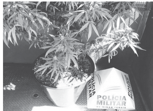
Mulher cultivava pé de maconha em sua residência, no Rosentina