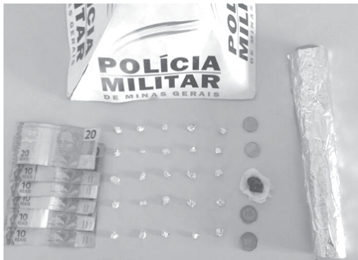
Após denúncia, PM apreendeu droga do bairro Nossa Senhora Aparecida