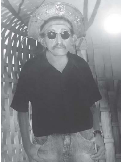
Paraíba vai fazer Show beneficente para construir o Clube das Crianças