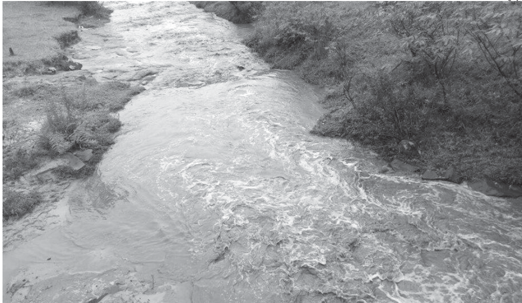
Poluição a recursos hídricos foi o mote que levou o vereador a ingressar com ação contra a empresa. Há dois anos ele vem estudando o caso

“O próprio gerente distrital da Copasa admite que todo o esgoto está sendo jogado no rio, pois estão aguardando o