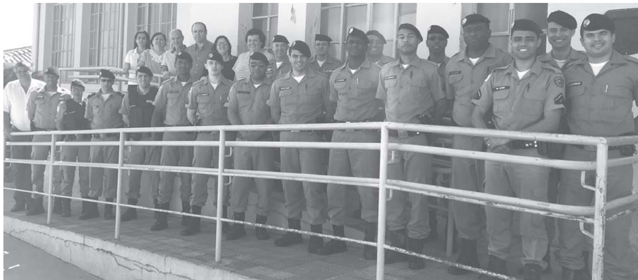
Autoridades, professores, lideranças políticas recepcionando a Banda do 12º Batalhão de Passos na E.E. Dr. Tancredo de Almeida Neves