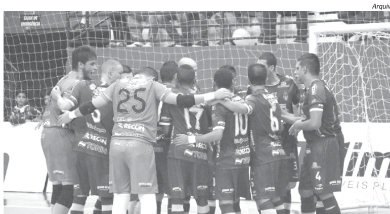
Intelli Paraíso Futsal volta à quadra em busca da reabilitação na LNF

Catarina em busca de um bom resultado já que na última vez que esteve na região, há cerca de 10 dias o time acabou sofrendo um revés e perdeu para o Jaraguá. Como ocorreu em várias partidas Paraíso até começou vencendo, mas acabou cedendo o empate e depois teve a virada por 2 a 1. Na última