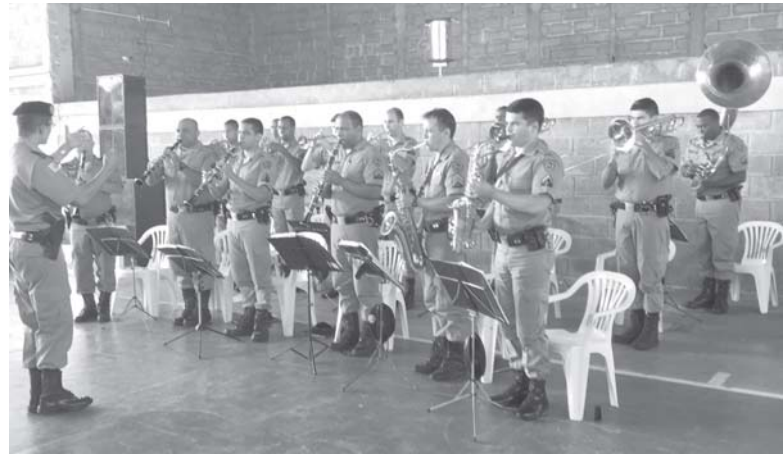
Apresentação da Banda do 12º Batalhão da Polícia Militar de Passos na abertura dos Jogos