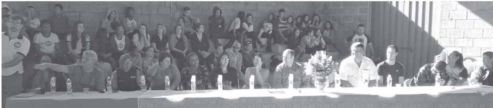
Composição da mesa para abertura dos Jogos Interclasses

A Escola Estadual Dr. Tancredo de Almeida Neves está realizando o seu II Jogos Interclasses da Independência. A abertura aconteceu dia 1º de setembro e o encerramento será nesta quarta, 6 de setembro na Praça de Esportes Dr. Antônio Joaquim da Silveira. Para um maior brilho do evento esportivo de São Tomás de Aquino a apresentação da Banda do 12º Batalhão da Polícia Militar de Passos. O objetivo da Escola Estadual aquinense é o de integrar os alunos dentro do espírito esportivo e numa vibração positiva de competição sadia e conagração. Os alunos estão participando nas modalidades futsal, handebol, xadrez, atletismo.