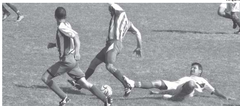
Futebol amador da cidade volta a se movimentar com início da Taça Paraíso

Ainda no final de julho foi realizado o Congresso Técnico em que aconteceu a entrega das fichas para a inscrição dos atletas que disputarão o campeonato. Também foram confirmadas as participações