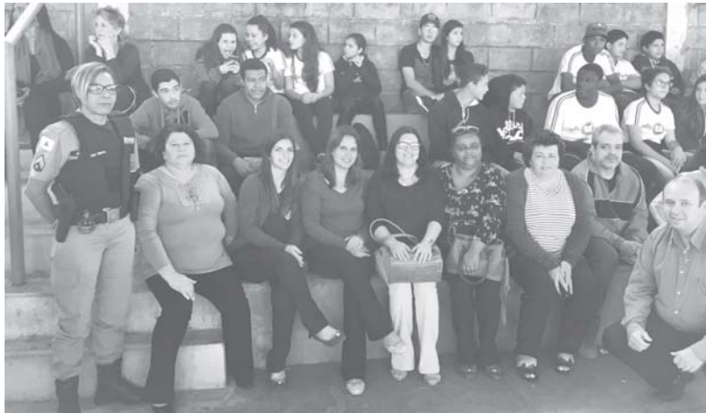
Professores, autoridades, convidados na abertura dos Jogos Interclasses