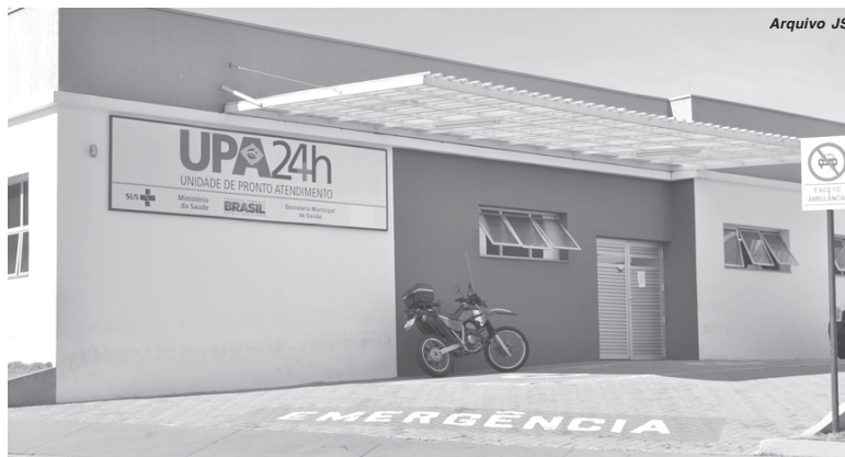
UPA de Paraíso foi inaugurada inacabada e agora recebe recursos do governo para sua manutenção

O ministro da Saúde, Ricardo Barros, anunciou nesta quinta-feira (5/10), o repasse de recursos federais para custear e qualificar os serviços ofertados à população de 46 Unidades de Pronto Atendimento (UPA 24h). A população de 43 municípios serão beneficiados com a ampliação de assistência na urgência e emergência. As unidades vão receber do Ministério R$ 93,2 milhões por ano. No caso de São Sebastião do Paraíso o repasse é superior a R$ 2,5 milhões. Desde o ano passado, outras 155 passaram a receber contrapartida federal.