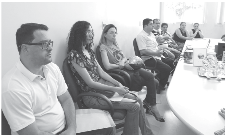
Em reunião, servidores tinham explicado todo o processo. Solicitante da CEI não havia comparecido

"Você comprar carne para sua casa é uma coisa, mas para 5 mil alunos é outra coisa completamente diferente. Antes, essa carne que chegava congelada, tinha que ficar de um dia para outro descongelando, correndo risco de contaminação, além de todo o processo de preparo que tomava muito