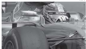
Mesmo com os "altos e baixos" da Mercedes, Hamilton conseguiu ampliar vantagem sobre Vettel

Nesta madrugada tem o GP do Japão com largada às 2h, pelo horário de Brasília, e lá as temperaturas deverão ser mais baixas que as da Malásia. Para a Mercedes isso é bom já que seus carros têm desempenho melhor