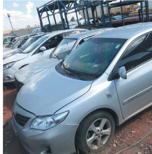
Conforme o edital foram colocados à venda mais de 370 itens entre veículos conservados e sucatas