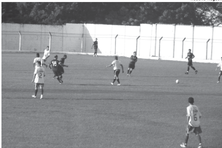
Bola rola neste final de semana em vários gramados para a segunda rodada da Taça Paraíso séries A e B

A Taça Paraíso de Futebol Amador, de São Sebastião do Paraíso, tem neste domingo, 8, a realização da segunda rodada da competição. Seis jogos foram programados válidos pela Série A e outras quatro partidas serão realizadas na Série B. Na abertura do torneio foram marcados 24 gols, média de 2,4 por jogo, mesmo levando em consideração que uma partida não foi realizada.