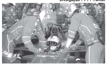
Problema em uma das velas de ignição tirou Vettel da corrida, em Suzuka

A seguir, os problemas mecânicos de Vettel foram consequências de uma equipe que sentiu o golpe. Na Malásia os mecânicos falharam na montagem às pressas do motor do carro do alemão que precisou ser trocado pouco antes do trei-