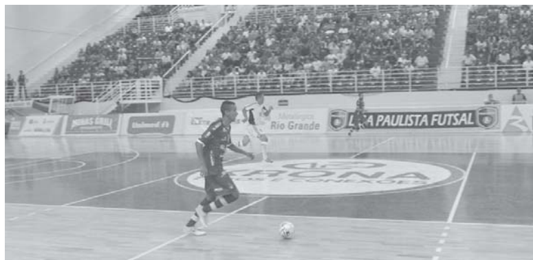
Diante da torcida time de Paraíso busca primeira vitória na Copa Paulista

Para tentar melhorar na tabela de classificação a Intelli terá de superar o Hortolândia neste sábado, 13. As duas equipes ainda não conseguiram vencer e o resultado positivo será melhor para quem for vencedor. Paraíso vai contar com a força de sua torci-