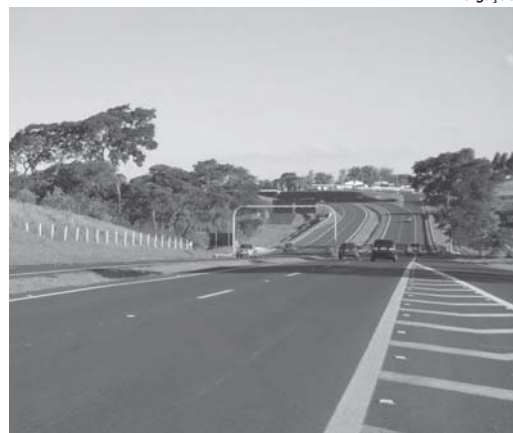
Novas pistas foram liberadas para receber o grande trânsito a partir deste feriado prolongado

A duplicação do trecho de dez quilômetros, era exigência prevista no atual contrato de concessão da Autovias e deveria ser iniciada quando o VDM (Volume Diário Médio) de tráfego atingisse 5 mil veículos.