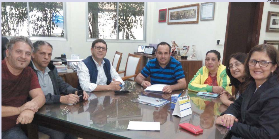
Diretoria do Sind-Educ/SSP se reuniu com prefeito para levantar demandas da categoria e discutir situação do servidor