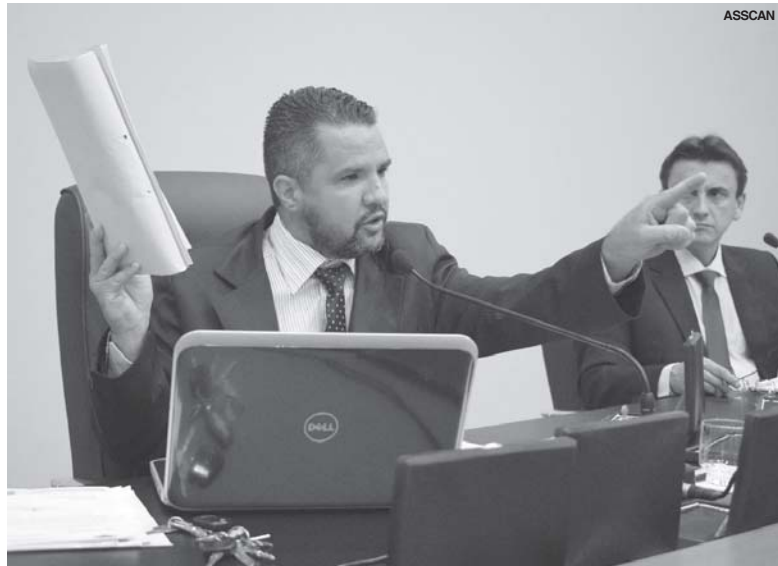
Vereador afirmou que projetos do Executivo só darão entrada na pauta da Câmara quando solicitações do Legislativo forem atendidas