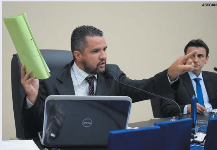
Vereador afirmou que projetos do Executivo só darão entrada na pauta da Câmara quando solicitações do Legislativo forem atendidas