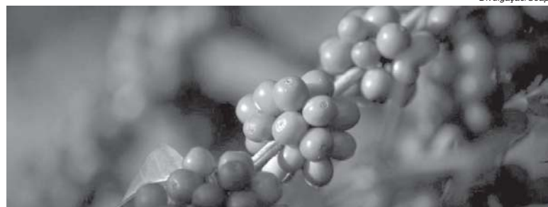
O café, principal produto da pauta de exportações do agronegócio, representou 41,3% do valor total exportado

O valor alcançado com a comercialização foi de US$ 2,5 bilhões, indicando aumento de 5,1% em relação ao registrado