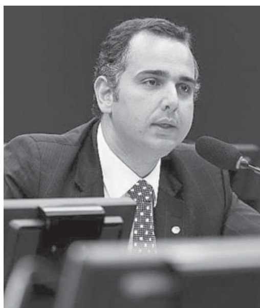
O deputado federal Rodrigo Pacheco (PMDB)

O deputado Rodrigo Pacheco afirmou que, com muito empenho, compromissos estão sendo cumpridos, mas isso não o demove de continuar lutando para dar continuidade ao esforço de promover o bem-estar dos moradores. "Estamos conseguindo cumprir com vários compromissos, em todas as áreas, e levar adiante as demandas do município, principalmente, nesse momento de muitas dificuldades financeiras. Mas o trabalho e a dis-