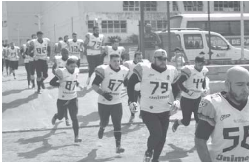
Paraíso Miner's confirma boa fase na disputa do campeonato interestadual de futebol americano

Neste final de semana começa a primeira rodada da Copa Mogiana de Futebol Americano!