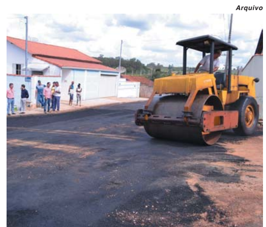
Programa prevê obras de melhorias nas ruas da cidade com recapeamento de vias