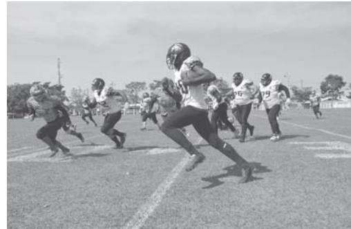
Time de futebol americano de Paraíso venceu o Araxá Red Wolves com ampla vantagem

a sequência de bons resultados na competição com três vitórias seguidas na primeira fase. Na estreia a equipe paraisense venceu no Triângulo Mineiro, o Uberaba Zebus, por 24 a 18 em Uberaba. Em seguida o time esteve na cidade vizinha e derrotou o Passos Madbulls, por 30 a 0.