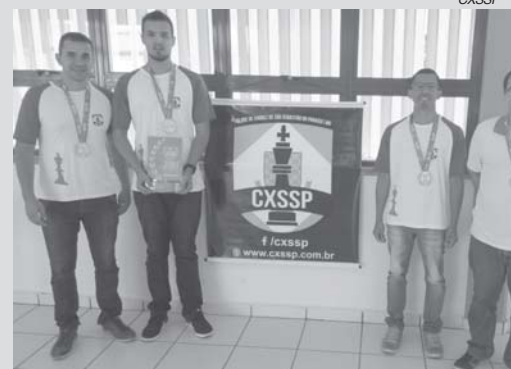
Equipe paraense de xadrez foi vice-campeã dos Jogos do Interior de Minas (JIMI)

Rodada 2: São Sebastião do Paraíso 2 x 0 Campo Belo.