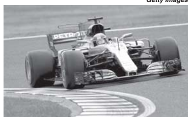
A exemplo de 2015, Lewis Hamilton pode novamente sair campeão dos Estados Unidos

Outra novidade no GP dos Estados Unidos é a adesão da Fórmula 1 pela primeira vez na campanha "Outubro Rosa". Faixas que limitam a pista foram pintadas na cor rosa. Os três primeiros colocados na corrida usarão boné cor-de-rosa na cerimônia do pódio que terá ainda as garrafas de champagne da mesma cor. Alguns caracteres das imagens de TV também serão rosa, e os pneus de composto ultramacios que a Pirelli levou para o final de semana, excepcionalmente ganharam faixa cor-de-rosa no lugar do tradicional roxo.