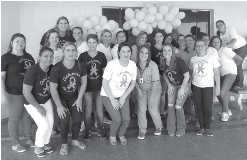
Funcionárias convidadas do evento de Saúde

A Secretária Municipal de Saúde de São Tomás de Aquino realizou o Dia Especial no Outubro Rosa (25/10) para a mulher funcionária pública, da administração municipal. Um dia importante para falar e refletir sobre a Saúde. Na parte da manhã aconteceu coleta de