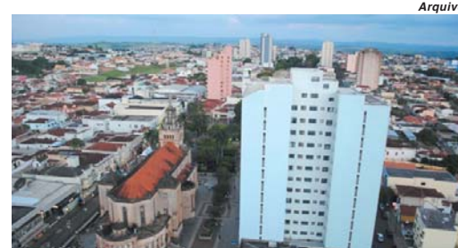
Paraíso e demais municípios recebem repasse do FPM oriundo da União

Este repasse ocorre separadamente porque a Receita Federal tem um programa que parcela as dívidas de vários impostos. Quando a pessoa jurídica ou até mesmo a pessoa física efe-