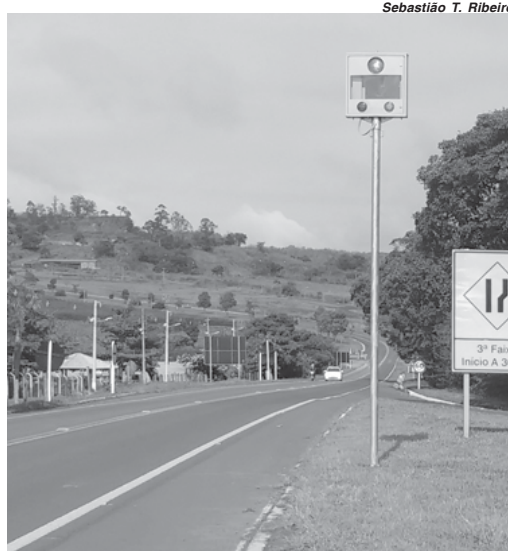
Sebastião T. Ribeiro

Vale lembrar que referidos radares têm a função de inibir e fotografar e prevenir infrações no trânsito, mas também