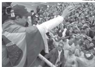
Agora é pra valer: GP do Brasil, amanhã será o último de Felipe Massa, em Interlagos

E tem também a segunda – agora definitiva – aposentadoria de Felipe Massa. Ele mesmo faz questão de dizer que agora não terá volta. Ano passado Massa foi ovacionado pelo público e até por membros de equi-