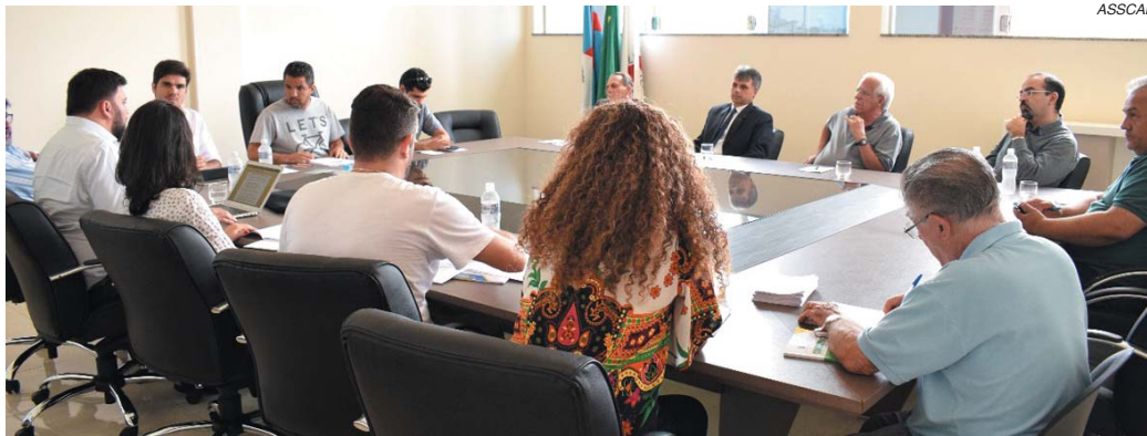
Debate inicial trouxe problemas do dia a dia enfrentado pelos vereadores e importância da participação popular no processo de atualização da Lei

Sobre a Lei Orgânica de Paraíso, o consultor destaca que por ser uma lei de 1990, desde então a Constituição Brasileira já sofreu cerca de 97 emendas e segundo destaca é