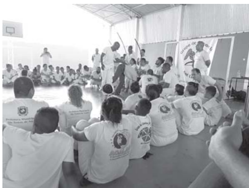
Evento do Grupo de Capoeira Axé Liberdade

O Centro de Referência e Assistência Social - CRAS - realizou dia (5/11) na Escola Municipal Santo Tomás de Aquino apresentação de batismo, troca de cordas e formatura do projeto Oficina de Capoeira. Nunca é demais ressaltar o valor dos projetos que o CRAS Jairo de Lima reali-