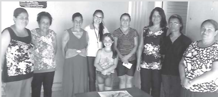
As participantes fizeram a receita Cookie de Aveia

cessidade de um prévio encaminhamento por profissional que atua na área da Saúde. Ainda neste final de ano acontecerão encontros a exemplo: Grupo da Memória nos dias 29 de novembro e 13 de dezembro no Salão da Pastoral. Oficina Culinária dia 6 de dezembro. Alimentação Saudável e Emagrecimento nos dias 29 de novembro e 20 de dezembro no Sindicato e nos dias 13 e 27 de dezembro Salão do PSF do Rosário. Para o ano de 2018 nova programação e novas datas que serão comunicadas a tempo para todos que participam.