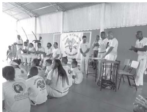
Participantes do Evento na Escola Municipal

para os alunos. Deve conduzi-los para a prática do bem, da disciplina, de valores para a prática na vida, de boas notas na escola. Formar cidadãos conscientes de seu papel na sociedade. Ele salientou "sou professor mas continuo aluno. Estou sempre pronto a aprender, sempre