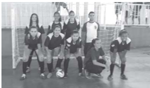
Sub 15 Feminino