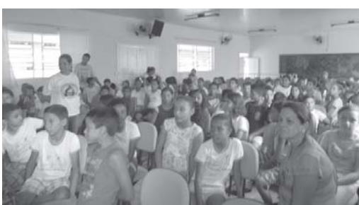
Alunos do Vespertino

que ficou esclarecido que tudo que nela contém está intimamente ligado ao município aquinense.