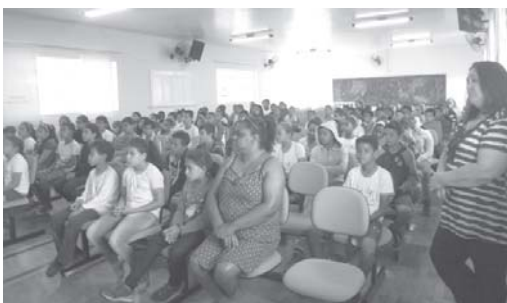
Alunos do Matutino