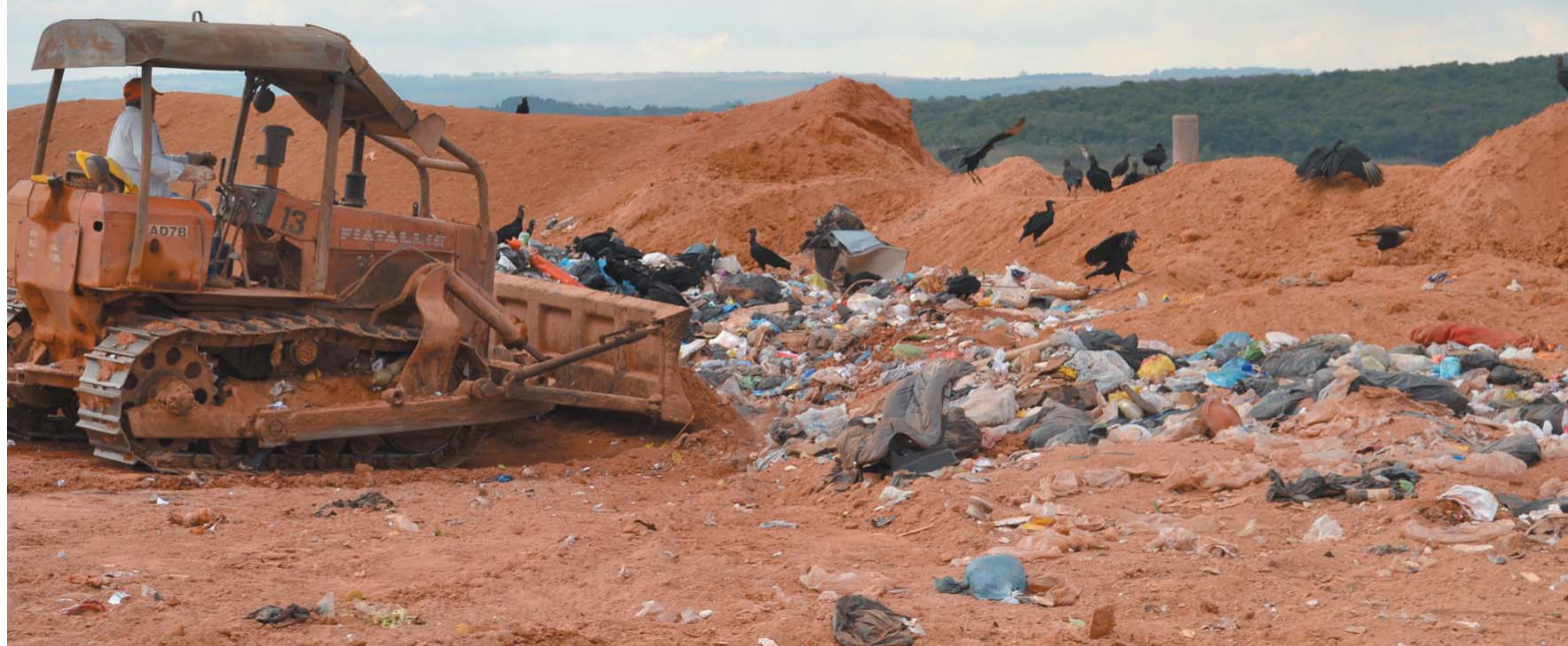
Em 2016, na gestão anterior, fiscais do Estado flagraram manejo inadequado no aterro sanitário em Paraíso

Inpar e Departamento Contábil municipal debatem orçamento do Instituto