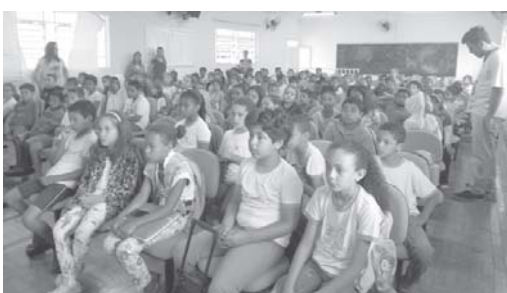
Alunos do Matutino

Os alunos fizeram várias perguntas a respeito do significado de tudo que estava estampado no seu brasão e todas foram respondidas o