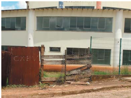
Neste vão, é onde frequentemente passam os elementos desocupados

Segundo informações, guardas municipais de vez em