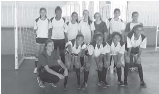
Sub 13 Feminino