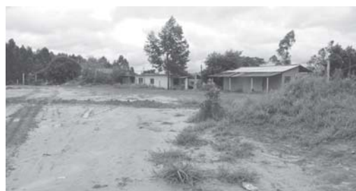
Área verde pertencente ao patrimônio Público Municipal, não tem calçada e está suja, no bairro Cidade Industrial

O município não deveria deixar isto acontecer e chegar