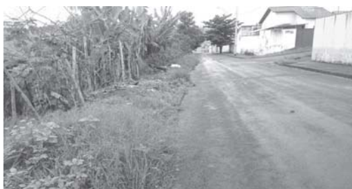
Área verde no bairro Itamarati II, onde está sendo ocupado sem autorização da Prefeitura

Câmara Municipal de São Sebastião do Paraíso - MG - Aviso de Licitação - Modalidade Pregão Presencial nº 010/17. A Câmara Municipal de São Sebastião do Paraíso comunica aos interessados que se encontra aberta a licitação na modalidade Pregão Presencial, objetivando a contratação de pessoas jurídicas para realizarem divulgação dos atos institucionais da Câmara Municipal em Mídia Sonora, conforme termo de referência, conforme Termo de Referência. As propostas serão recebidas até o dia 07/12/2017, até às 13 horas e 30 minutos, na Câmara Municipal, localizada à Av. Dr. José de Oliveira Brandão Filho, 445 - Jardim Mediterrâneo. Edital e maiores informações na Câmara Municipal de São Sebastião do Paraíso, ou pelo fone (35) 3531-4770, em horário de expediente, ou pelo site: http://transparencia.camarassao.org.br . mg.gov.br/licitacoes, 24 de novembro de 2017. Abdu Ferreira - Pregoeiro