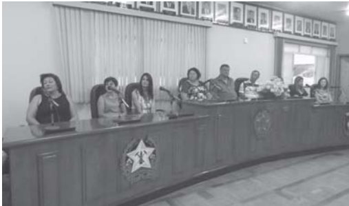
Composição da mesa