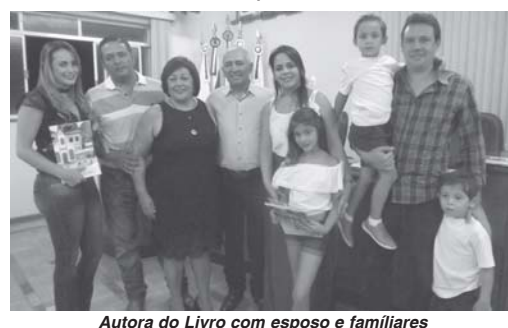
Autora do Livro com esposo e familiares