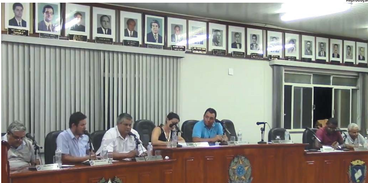
Vereadores voltarão a se reunir para votar o projeto polêmico na segunda-feira dia 18 de dezembro

Insegurança pública em São Tomás de Aquino