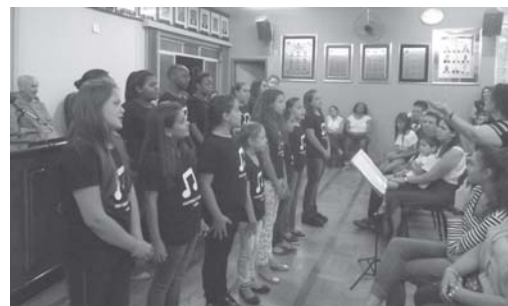
Apresentação do Coral Cantores de Cecília