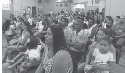
Convidados do evento cultural