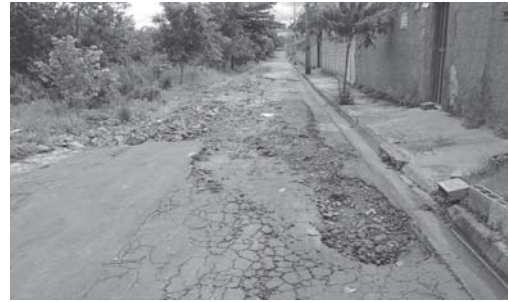
Já se passaram mais de 8 anos que estes buracos existem na rua Geraldo Pelúcio