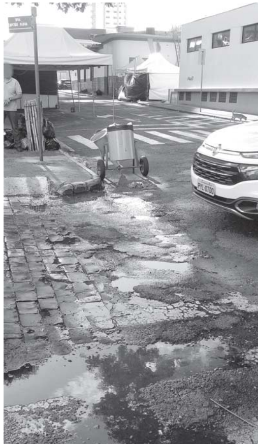
le local. "Presenciamos o descarte dos rejeitos, diga-se água suja de óleos, detergentes, e sobras de comidas em uma pequena enxurrada de esgoto a céu aberto em pleno Centro de

Segundo o reclamante, desde o ano passado, quando se decidiu aglomerar as lanchonetes em frente à Biblioteca Municipal e ao banheiro público municipal, em uma única praça de alimentação, cidadãos têm percebido descaso com o meio ambiente e aos vizinhos daque-