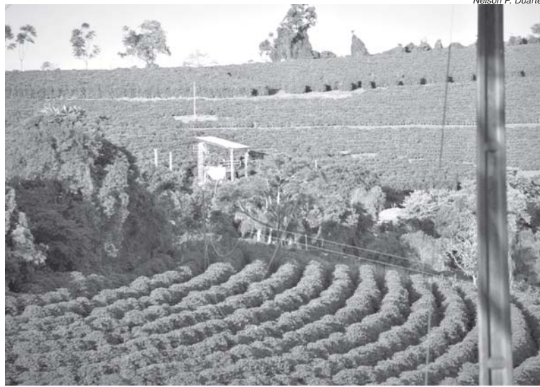
Nelson P. Duarte

A Companhia Nacional de Abastecimento (CONAB) divulgou os resultados do levantamento da safra brasileira de café em 2017 que está estimada em 44,97 milhões de sacas de 60 kg, com uma redução de 12,5% em relação ao ano anterior, quando atingiu 51,37 milhões. A área colhida também caiu. A redução foi de 4,3%, resultando em 1,87 milhão de hectares.