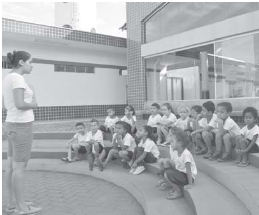
Levantamento auxilia governos na montagem da logística de atendimento na Educação