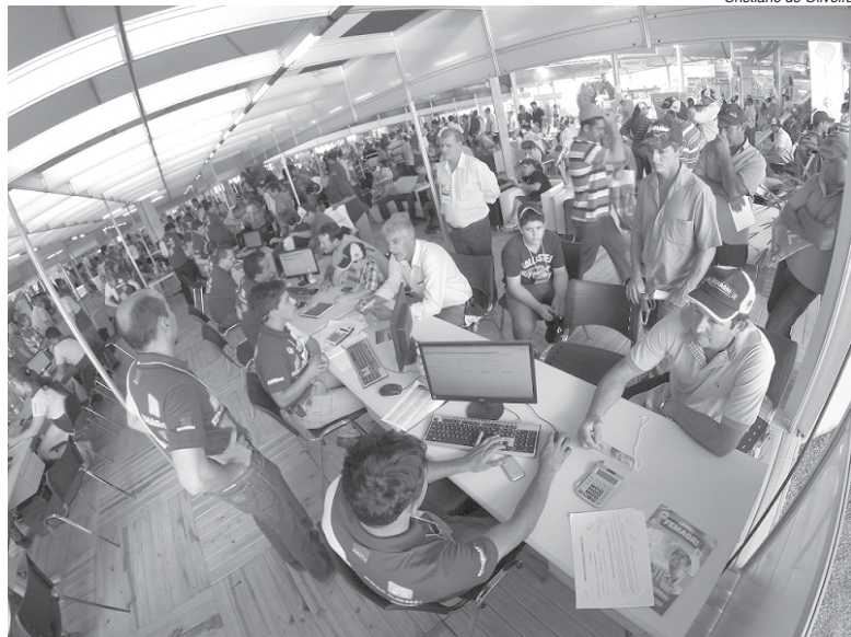
FEMAGRI 2017 espera receber 35 mil pessoas em 3 dias em Guaxupé/MG

A 17ª edição da FEMAGRI - Feira de Máquinas, Implementos e Insumos Agrícolas - um dos principais eventos voltados para o produtor de café acontece entre os dias 21 e 23 de fevereiro em Guaxupé. O evento é organizado pela Cooxupé - Cooperativa Regional de Cafeicultores em Guaxupé.