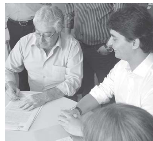
Deco assina convênio

Conforme pesquisa de 2000 do Instituto Brasileiro de Pes-