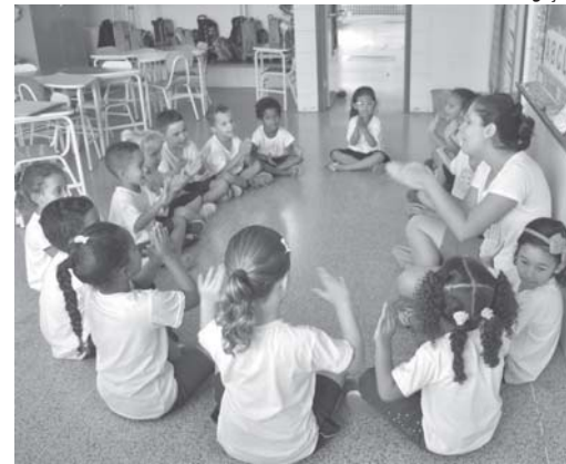
Coleta de dados nas escolas e creches abrange as diferentes etapas e modalidades da educação básica

O Inep (Instituto Nacional de Estudos e Pesquisas Educacionais Anísio Teixeira) publicou no Diário Oficial da União, na terça-feira, 26, os resultados finais referentes à primeira etapa do Censo Escolar de 2017, com informações da Matrícula Inicial das redes públicas estaduais e municipais.