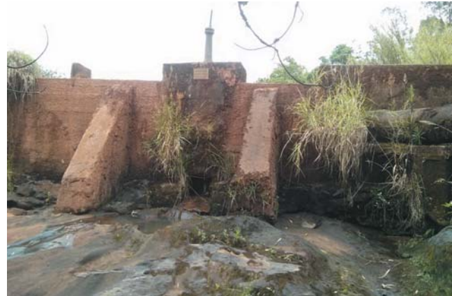
Captação de água Rio dos Pilões