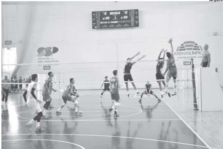
Paraíso realiza competições em parceria com o Governo de Minas ampliando chances de pontuação no ECM Esportivo

Com a posse também nesta semana dos membros do Conselho Municipal de Esportes de