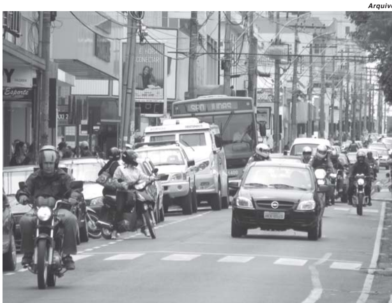
Metade do valor pago pelo contribuinte de IPVA deve entrar nos cofres do município

Neste ano, na comparação com 2017, a redução média da base de cálculo do IPVA - que