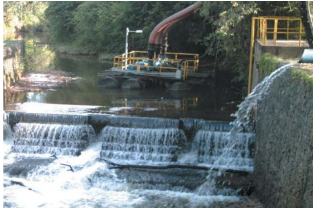
Captação de água Rio Santana

programa de recuperação de bacias hidrográficas pela Organização das Nações Unidas e foi adotado pelo Estado de Minas Gerais.