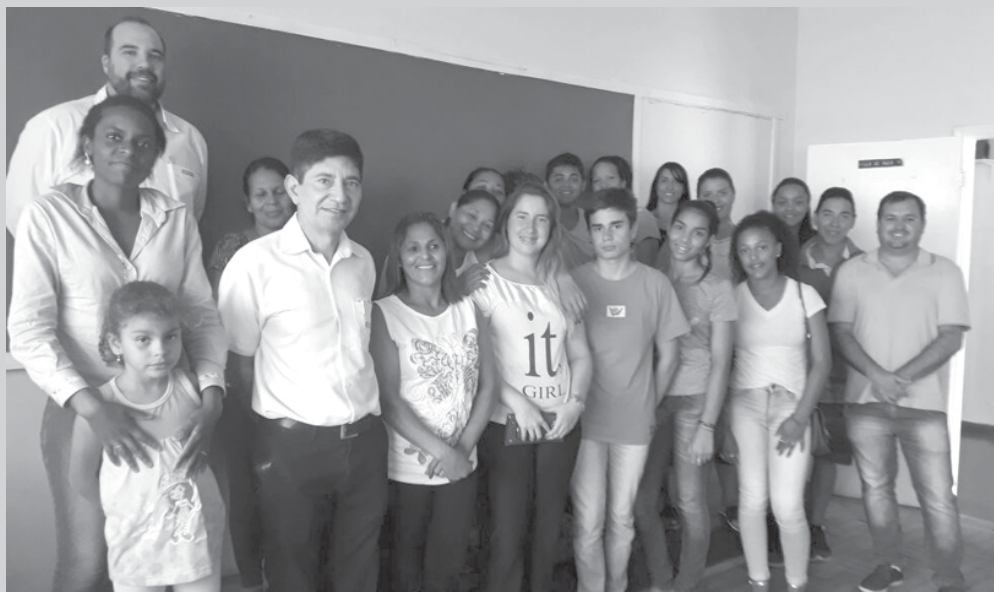
Inscritos para o Curso do SENAI