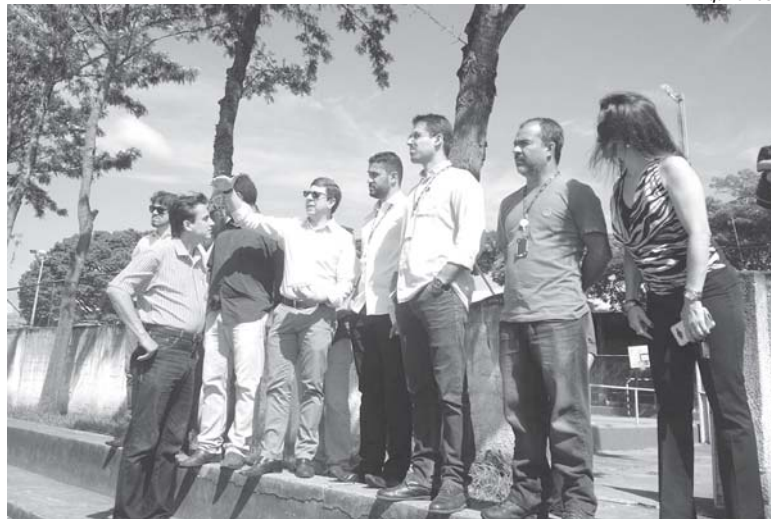
Em março de 2017, equipe do Sesc estiveram na Praça de Esportes para fazer avaliação do local

“A doação das áreas vem sendo discutida há tempos, inclusive isso foi veiculado em toda imprensa escrita e falada e, devido à oportunidade e a urgência que o caso exige, foi protocolado na Câmara este projeto para que seja votado e a cidade possa se beneficiar de duas instituições sérias para atender aos cidadãos paraisen-