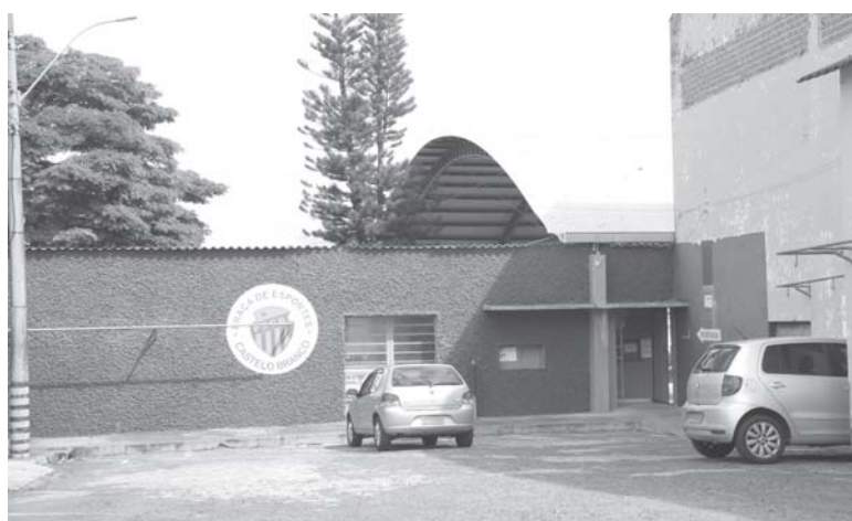
Praça de Esportes Castelo Branco poderá abrigar instalações do SESC, projeto aguarda aprovação da Câmara

"O que o Sesc pode oferecer ao município é inacreditável. Estamos falando em pegar crianças em estado de vulnerabilidade e entregar formados para a família. As crianças ficarão na parte da manhã, e na parte da tarde poderão utilizar esse espaço para realizar várias atividades educacionais. É um ganho social muito grande; além do que todo