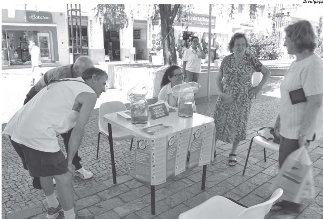
Mosquito da dengue pode transmitir até mesmo a febre amarela e outras doenças

Daniela confirmou também que no final de 2017 foram encontrados três macacos mortos no perímetro urbano de