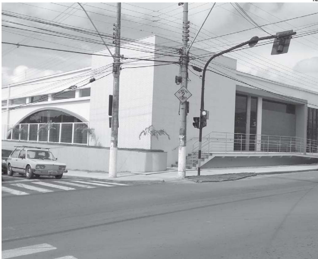
A atual sede da Justiça Federal em Paraíso é alugada e funciona em um prédio na Avenida Oliveira Resende

Na área do Judiciário, atendendo o chamado para a interiorização da Justiça Fe-