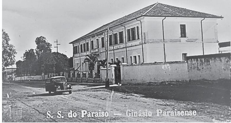
S. S. do Paraíso — Ginásio Paraisense