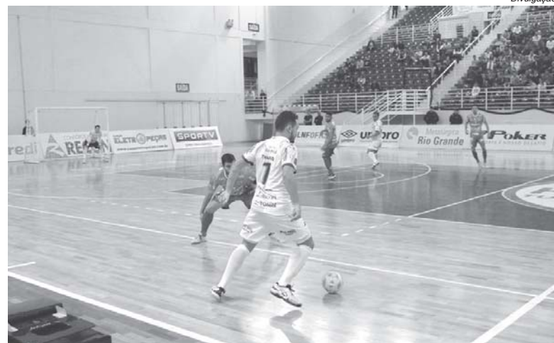
Intelli Paraíso começa a montar o elenco para os jogos na Arena Olímpica e disputa pelo Brasil

Dentre as demais equipes confirmadas para a disputa da competição estão os campeões Carlos Barbosa, Jaraguá, Corinthians, Magnus, Intelli e o último vencedor, Joinville. Os franqueados São José e Cascavel voltam nessa temporada. Também têm participações confirmadas as equipes do Assoeva, Atlântico, do Rio Grande do Sul. De Santa Catarina constam Jaraguá, Joaçaba, Joinville e Tubarão. Entre as equipes paranaenses está o