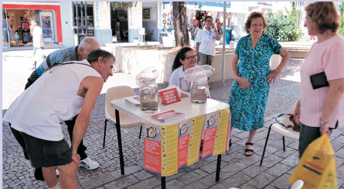
Mosquito da dengue pode transmitir até mesmo a febre amarela e outras doenças