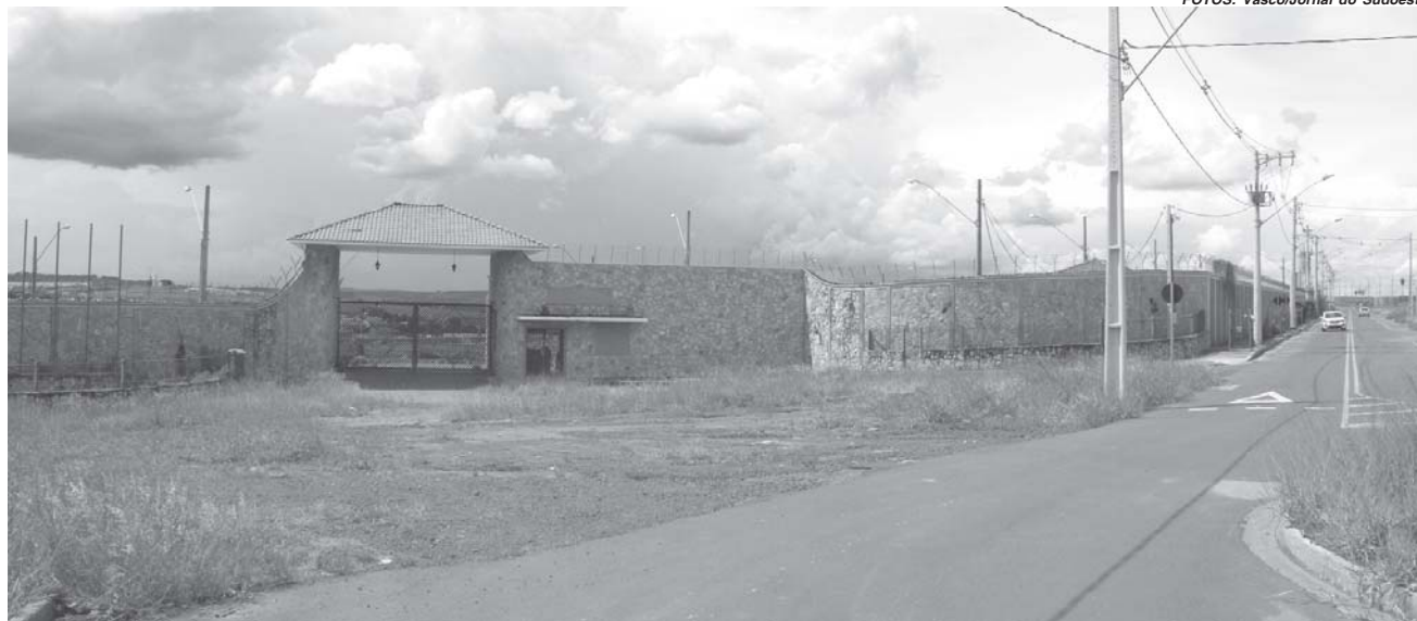
Área do SESC localizada no Jardim Mediterrâneo é pleiteada para ser futuras instalações da UFLA