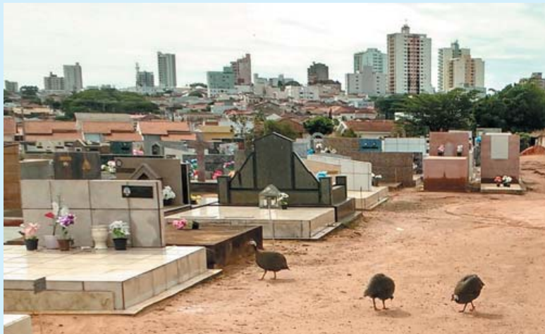
Galinhas de Angola a procura de escorpiões no cemitério da cidade