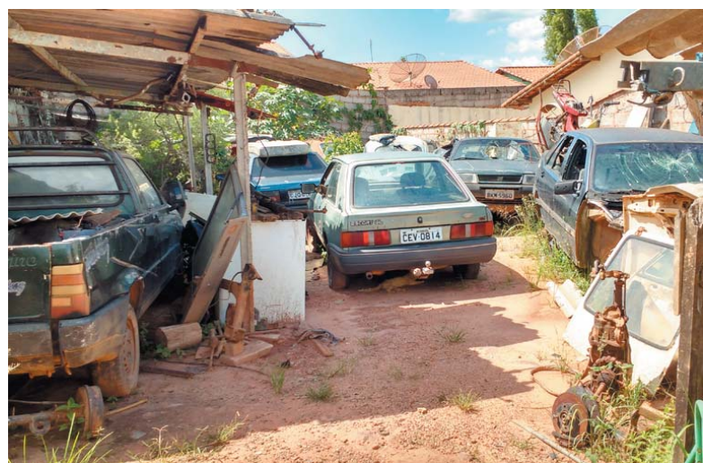
Carros velhos abandonados em um terreno no bairro Cidade Industrial

E aqueles anúncios que a prefeitura fez no ano passado, afirmando que iria retirar carros abandonados de vias públicas de Paraíso?