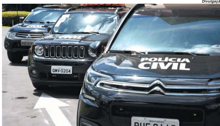
Veículos destinados aos municípios mineiros serão utilizados nos trabalhos da perícia criminal da Polícia Civil

Segundo o governador, as viaturas serão essenciais para equipar a perícia técnica. "A Polícia Civil é fundamental para a resolução daquilo que começou, muitas vezes, em um evento que tem a presença da Polícia Militar, mas que só se conclui se a Civil cumprir bem o seu papel. E é isso que nós estamos mostrando em Minas Gerais, com a queda dos índices de criminalidade", disse.