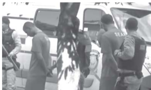
Por João Oliveira

Por decisão da Secretaria de Estado de Administração Prisional de Minas Gerais, a Unidade Prisional do município de Itamogi foi desativada nes-