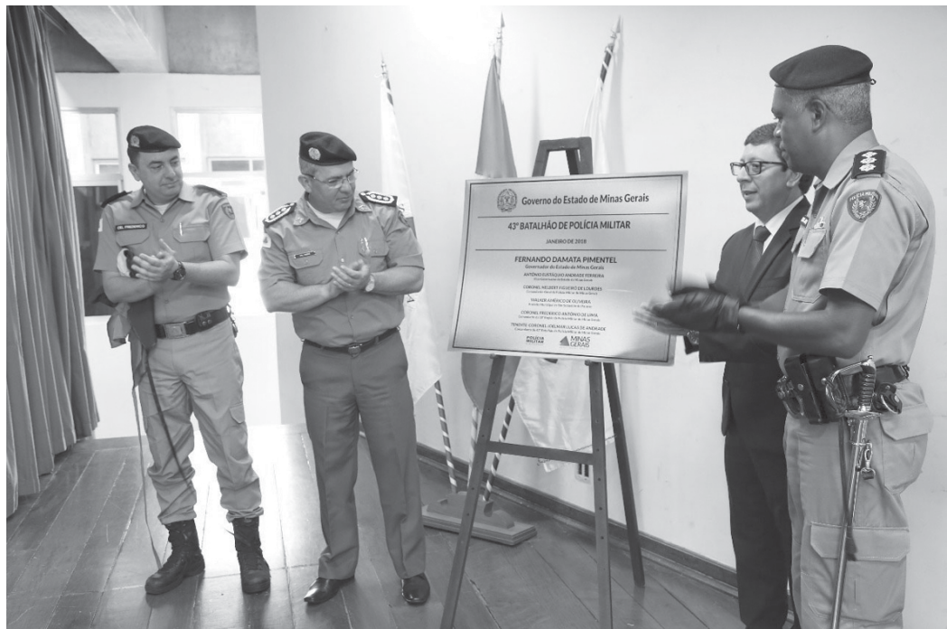
Autoridades fazem descerramento da placa do 43º Batalhão de Polícia Militar em Paraíso

grado aspirante a oficial em 31 de outubro de 1997.