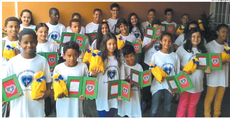
Programa de integração sociocultural da LBV também têm aulas de violão

A unidade da LBV (Legião da Boa Vontade) em São Sebastião do Paraíso abre matrículas para a temporada 2018 do Programa Jovem Futuro no Presente. A iniciativa tem por objetivo na faixa etária de possibilitar a ampliação do universo informacional, artístico e cultural de adolescentes na faixa etária de 11 a 16 anos. As inscrições foram iniciadas na terça-feira, 23, e vão até 23 de fevereiro, sendo que ainda existem disponíveis metades das 80 vagas disponibilizadas.