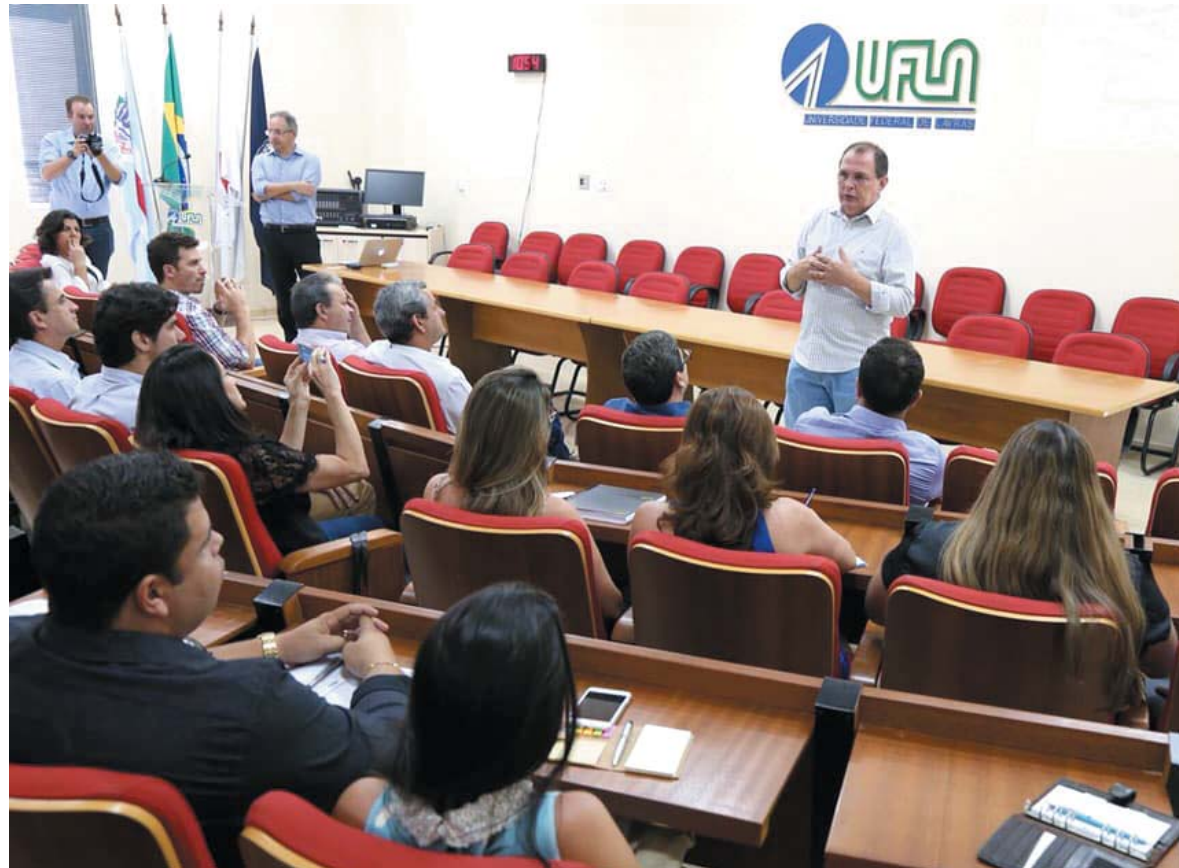
Em reunião, reitor da Ufla apresentou projeto da implantação da Universidade em Paraíso e esclareceu dúvidas