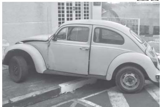
Por João Oliveira

Um acidente registrado entre dois Fuscas no início da noite de segunda-feira (22/1) deixou duas pessoas feridas, entre elas o condutor de um dos veículos, de 58 anos, e sua passageira, de 46 anos. O fato aconteceu na confluência da rua Genaro Joelle com a Douro Delfim Moreira. No impacto, a mulher chegou a ser arremessada para fora do veículo e apesar da gravidade vítimas sofreram apenas ferimentos leves e foram encaminhadas à Santa Casa.