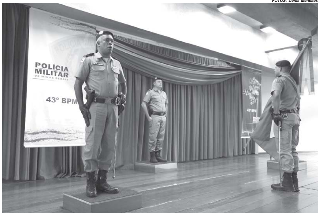
Rito de troca de Comando realizado no Teatro Municipal Sebastião Furlan

Em 1992 foi promovido a cabo PM após concluir o Curso de Formação de Cabos, também em Governador Valadares; em fevereiro de 1994 foi aprovado no Curso de Formações de Oficiais da Academia da Polícia Militar de Minas Gerais em Belo Horizonte, tendo se consa-