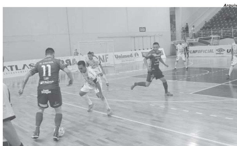
Com mando de campo invertido Intelli Paraíso repete estreia na LNF 2018, contra o Pato Futsal

A tabela ainda é provisória, mas pelo que tudo indica, o mando de quadra ao menos já é oficial para a primeira fase da Liga Futsal 2018. Com 19 equipes confirmadas, cada agremiação terá direito na primeira fase a nove jogos em