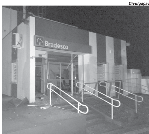
Agência invadida por ladrões em Fortaleza de Minas durante a madrugada

Este foi o primeiro caso de ataque à agência bancária na região próxima a São Sebastião do Paraíso neste ano. Em 2017, a cidade sofreu com uma ação violenta no centro da cidade e que destruiu as instalações do Banco Mer-