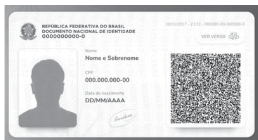
Exemplo de telas geradas na emissão do DNI

Documento único vai reunir título de eleitor, CPF e certidão de nascimento, entre outros. Saiba como será a emissão e quais os benefícios da DNI