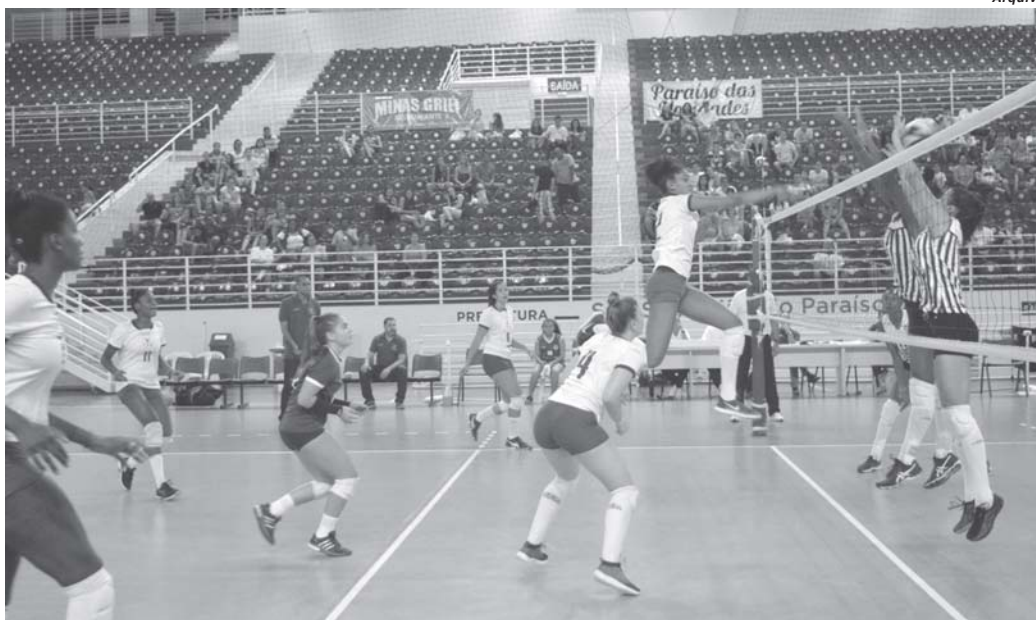
Em 2017 a Arena Olímpica recebeu jogos das seleções estaduais de vôlei em grandes duelos em quadra

A Confederação Brasileira de Voleibol divulgou na segunda-feira (5/2), o calendário para a temporada dos Campeonatos Brasileiros de Seleções (CBS). A tradicional competição de base do voleibol nacional terá 12 eventos em nove estados do País. Pelo segundo ano consecutivo São Sebastião do Paraíso foi confirmada como uma das sedes dos jogos devendo receber delegações de vários atletas de diferentes estados em duas diferentes épocas do ano.