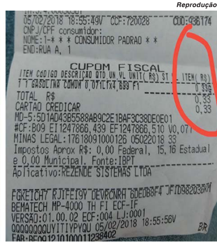
Insatisfeitos com valores, manifestação organizaram mobilização pelas redes sociais