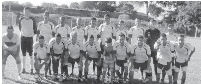
C.V.A. (Clube Veteranos Aquinense)

rem presença, prestigiando os atletas da cidade e os visitantes no dia 4 de março, domingo, no Estádio Comendador Joaquim Pedro da Silveira. A equipe Teneré bicampeã está defendendo o 3º título nesta 3ª Copa de futebol amador.