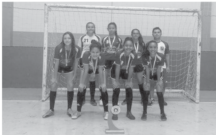
Equipe feminina Futsal sub-13