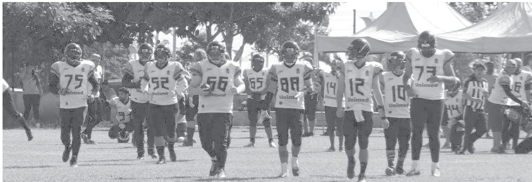
Equipe do Paraíso Miners está de volta aos campos para temporada 2018 do futebol americano

Depois da conquista do vice campeonato da Copa Mogiana de Futebol Americano, a equipe do Paraíso Miners iniciou no sábado, 24, a temporada de jogos de 2018. A equipe paraense foi a Pousa Alegre enfrentar o Gladiadores que venceu por 36 a 0 no primeiro amistoso do ano. O Miners segue em preparação para a disputa do Campeonato Mineiro que será disputado em março.