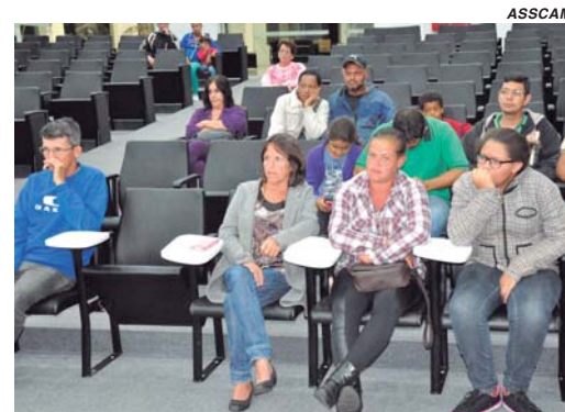
Moradores afetados estiveram em sessão da Câmara, onde assunto foi comentado