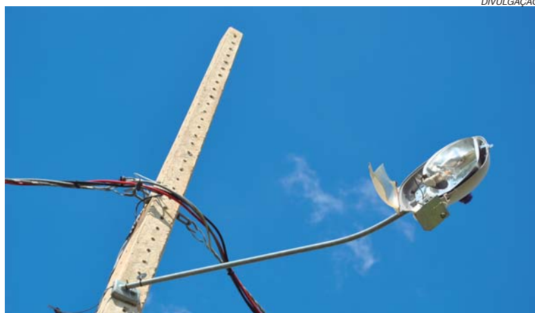
Na avenida Maria de Lourdes Arantes Almeida, no bairro Verona, poste foi um dos alvos de depredação entre tantos outros já atendidos pela serviço de manutenção da Prefeitura

Entre as praças que vem sendo alvo das ações delituosas, estão a Olegário Maciel, Praça Santo Antônio, São Judas, Nossa Senhora Aparecida, Verona e Praça dos Imigrantes, esta última com furto das luminárias instaladas no solo. Além disso, há também atos de vandalismo com destruição de luminárias através de tiros e pedradas no bairro Alto do Paraíso, Santa Tereza, Parque Belvedere e Nascentes do Paraíso. "Esse dinheiro gasto por decorrência de ações de