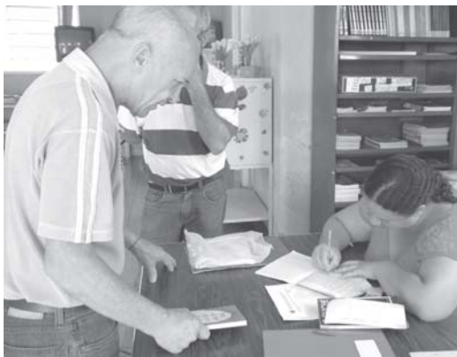
Prefeito fazendo sua ficha inscrição na Biblioteca