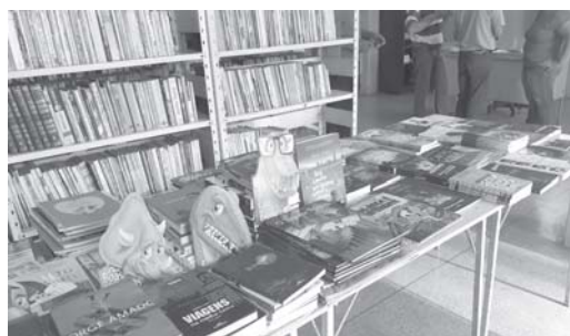
Novos livros da Biblioteca Municipal