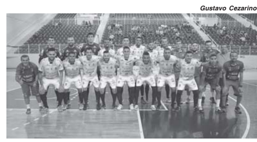
Intelli Paraíso vence amistoso antes da estreia na LNF, dia 15