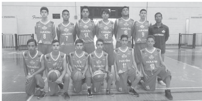
Time de basquete de Paraíso treinou forte para o primeiro amistoso contra a equipe passense

Depois de praticamente um mês em treinamentos o Paraíso Basquetebol iniciou a temporada 2018 com vitória em partida amistosa realizada em Passos contra a equipe local. Os paraisenses saíram de quadra com vitória marcando de maneira positiva o começo das atividades deste ano. Além dos jogos e competições que pretende disputar o Paraíso Basquetebol iniciou uma campanha de arrecadação para sócios doadores e torcedores que queiram ajudar a agremiação.