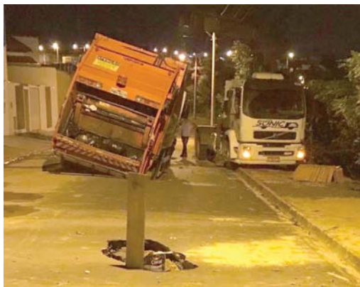
Caminhão ficou preso no buraco aberto no asfalto e teve que ser retirado do local por um guincho

Moradores do bairro alegam que diversos buracos naquela e em outras ruas do Jardim Canadá têm surgido a cada dia, mesmo a pavimen-