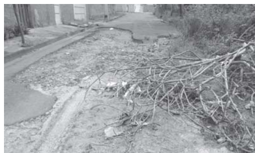
Já completou 5 anos que este enorme buraco existe na rua Geraldo Pelúcio no Jardim Planalto