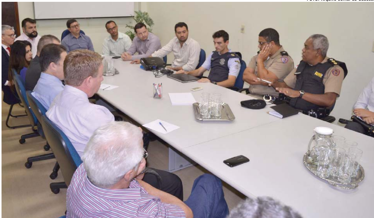
Lideranças se reuniram, mas adoções de medidas para aumentar a segurança foram descartadas devido aos custos.

Conselho Nacional de Educação aprova campus Ufla em Paraíso