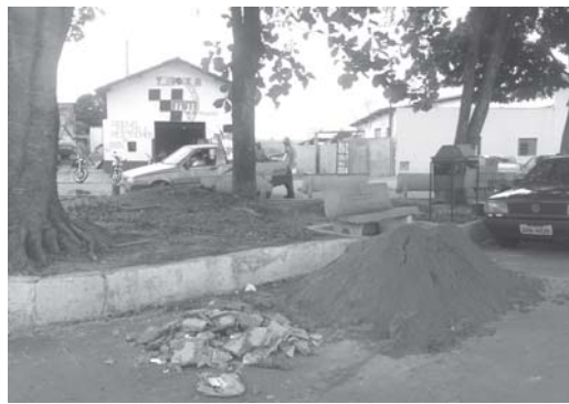
A Praça José Ribeiro da Silva está sendo revitalizada pela prefeitura municipal de São Tomás de Aquino.