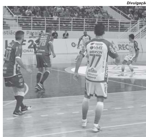
Intelli realiza nesta segunda-feira a terceira partida em casa na temporada, a primeira da Liga Paulista

A equipe da Intelli Paraíso volta à quadra nesta segunda-feira, (16/4), às 20h15, três dias depois de ter enfrentado o Tubarão, de Santa Catarina, pela Liga Nacional de Futsal. A partida diante do Mogi das Cruzes será válida pela segunda rodada da Copa Paulista de Futsal. O time local começou bem nesta competição, vencendo o Santo André fora de seus domínios, resultado que lhe dá o quarto lugar na tabela de classificação.