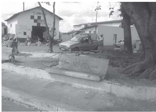
Bancos restaurados, nova grama com plantas decorativas a exemplo da Praça da Matriz. De roupa nova