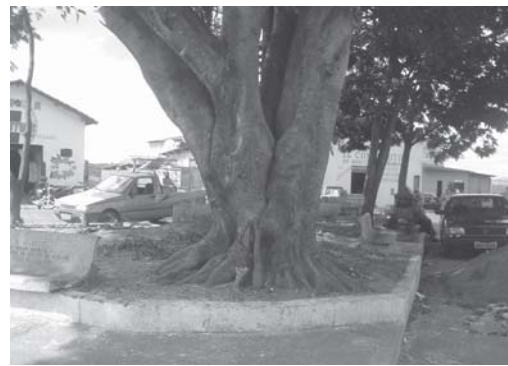
vai ficar a Pracinha do Dodô, como é conhecida pelos moradores da cidade. Uma satisfação para todos que