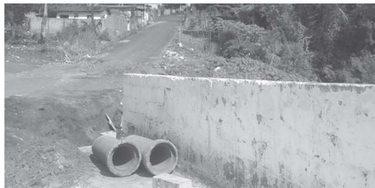
Ponte da Rua Dona Otília Amaral está sendo reformada na estrutura de sua base e as laterais. Sentido São Tomás de Aquino-São Sebastião do Paraíso.