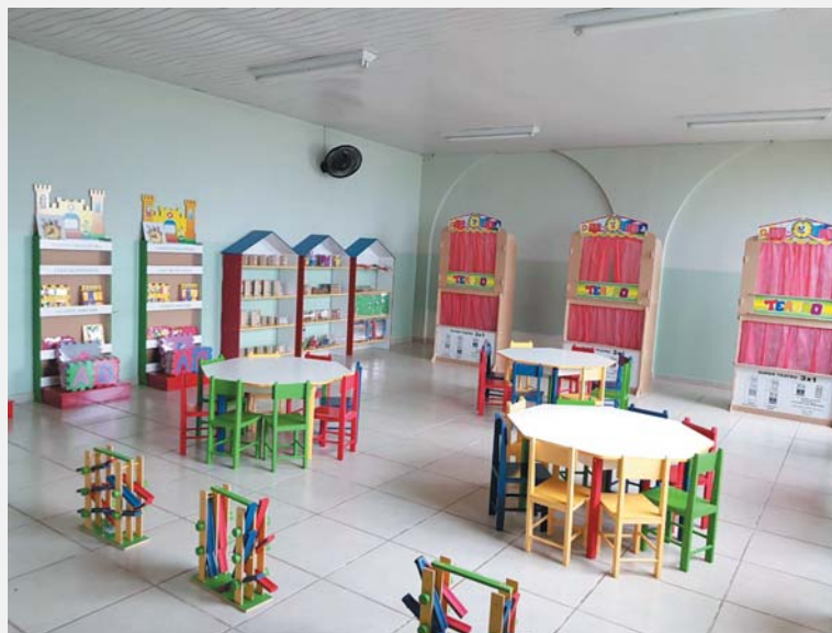
A brinquedoteca do novo curso de Pedagogia da Libertas - Faculdades Integradas