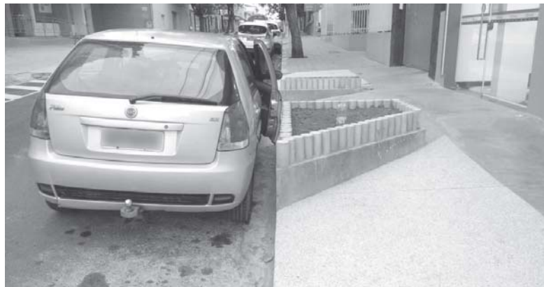
Canteiro construído em cima de calçada impede abrir a porta de veículos