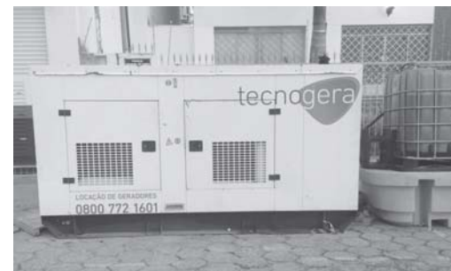
Este enorme Gerador que fornece energia elétrica para uma grande loja aqui em Paraíso

Quem passa pela praça, bem ao lado da casa paroquial, centro de São Sebastião do Paraíso pode ver o tamanho do gerador que está funcionando, dentro da via pública, para