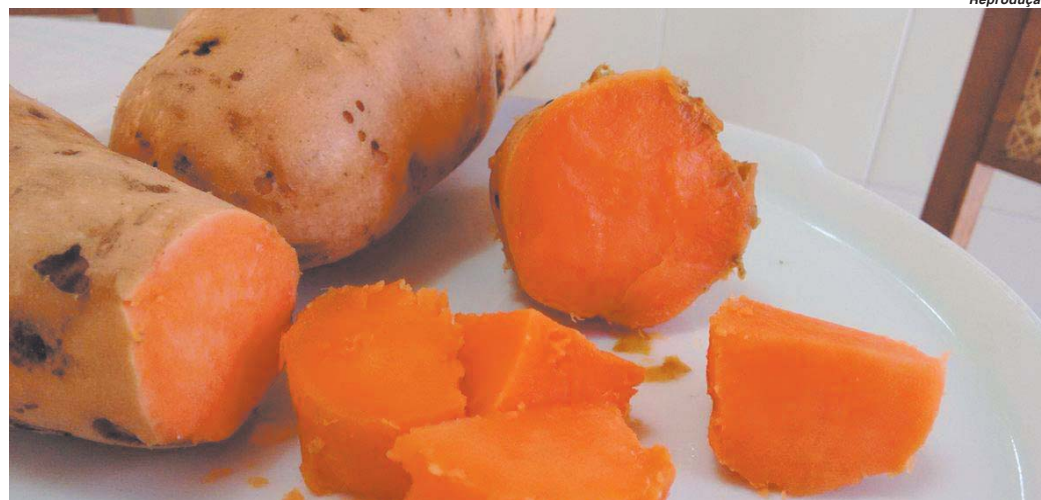
Batata-doce Beauregard é rica em betacarotenos, que ajuda no rejuvenescer o corpo, impedindo o crescimento de células não saudáveis

A qualidade Beauregard, conforme destaca o produtor, foi trazida para o Brasil e testada pela Empresa Brasileira de Pesquisa Agropecuária (Embrapa), que passou a recomendar o seu cultivo por este tubérculo apresentar um grande diferencial em relação aos de-