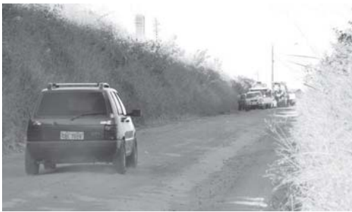
Obras realizadas a serviço de operadora de internet para instalação de rede trouxe perigo para o trecho