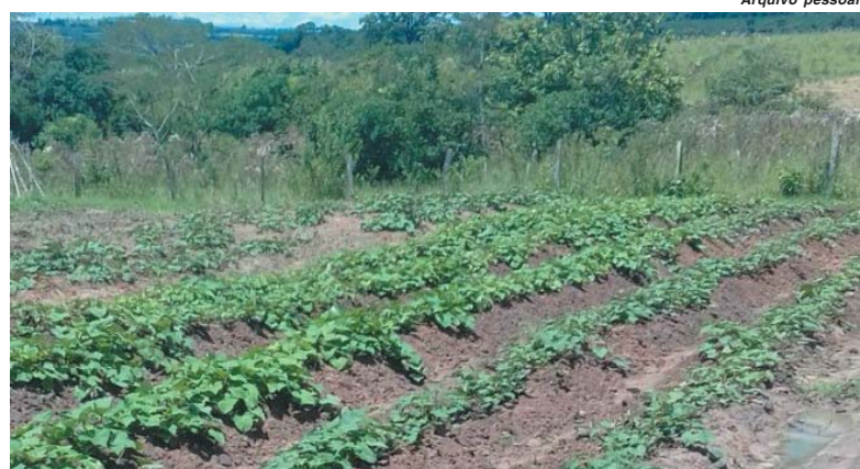
Variedades foram trazidas pelo produtor em novembro do ano passado e já passam a ser distribuídas nos mercados do município