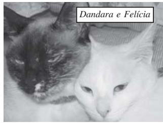
Dandara e Felícia

Portanto, "dono" não é quem adotou este animalzinho e sim aquele que se envolve espiritualmente desenvolvendo uma conexão. Não tenham medo de gatos; os aceite e os ame de todo o coração, pois quem "adota" um gato esta abrindo as portas da felicidade.