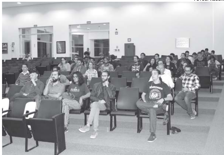
Pelos menos 30 pessoas ligadas a movimentos artísticos no município compareceram para acompanhar votação do projeto

sar sua arte e tão pouco pra dar início a uma possível aptidão para isto", defende.