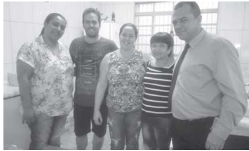
Equipe de colaboradores da quermesse