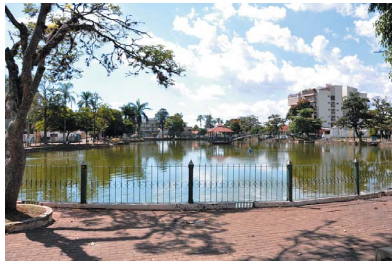
Prefeitura de Paraíso deverá prestar informações sobre a situação hídrica do município

A Prefeitura de São Sebastião do Paraíso por meio da Secretaria Municipal de Meio Ambiente (SEMAD) deverá informar ao Instituto Mineiro de Gestão das Águas (IGAM) sobre suas principais demandas relacionadas ao período de estiagem. Através de um levantamento, feito por meio de formulário a ser preenchido pelas administrações municipais, o órgão quer conhecer sobre a situação hídrica de cada cidade. As respostas apresentadas ao questionário servirão para levantar informações que subsidiem o desenvolvimento de ações mitigatórias dos impactos da seca.