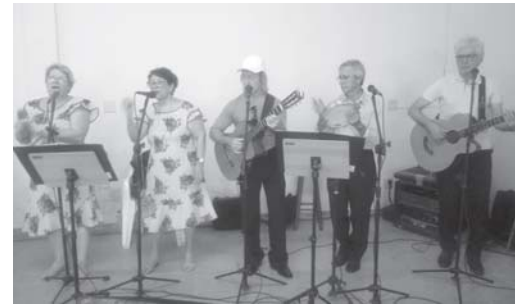
Paraíso em Seresta