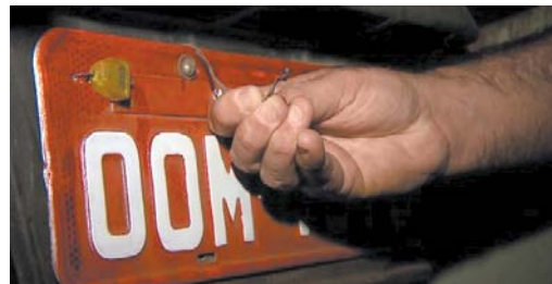
Veículo que teria sido roubado em Paraíso estava com placa clonada

A recuperação dos três caminhões pela Polícia Civil ocorreu na tarde de terça-feira, 10, em Ribeirão Preto. Os veículos estavam em um galpão no bairro Antônio Marincek. Dois caminhões tanques foram roubados no último final de semana em um posto de combustíveis às margens da rodovia Anhangüera, após os assaltantes renderem os motoristas. As vítimas ficaram em cativeiro em Serrana (SP) e foram liberadas somente na segunda-feira (9/7). Os caminhoneiros disseram à polícia que foram ameaçados, mas não sofreram ferimentos. Parte da carga de álcool, avaliada em R$ 130 mil, não foi