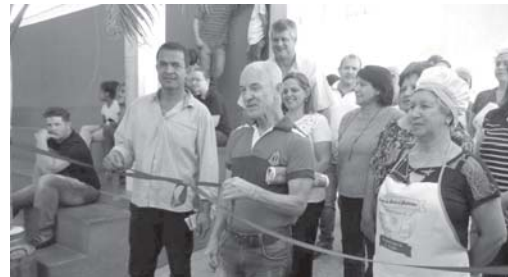
Abertura da festa