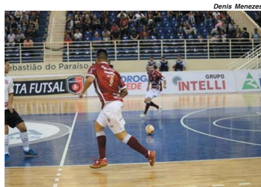
No intervalo dos jogos da Liga Nacional durante a Copa, Intelli Paraíso jogou pela Copa Paulista

A Intelli que nesta semana já havia conquistado um bom resultado na partida contra o Corinthians, na segunda-feira, 9, desta vez não vacilou diante de um adversário teoricamente mais fraco. O time não teve dificuldades para superar o adversário impondo seu ritmo de jogo mais intenso e cadenciando a disputa quando já estava com a vitória assegurada.