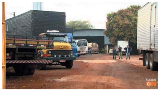
Caminhões roubados foram localizados pela polícia em um galpão em Ribeirão Preto