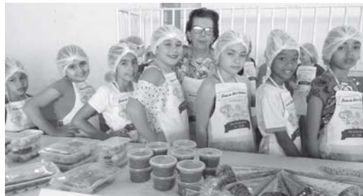
Quitandeiros - Doceiros - Queijeiros da 1ª Festa do Doce e Delícias de São Tomás