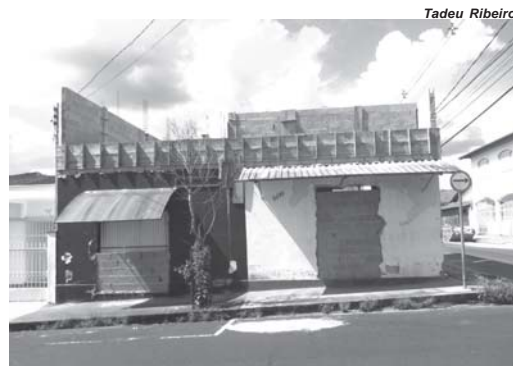
Em apenas duas semanas, este imóvel em construção foi furtado por três vezes

A reportagem do Sudoeste foi ao imóvel em construção para apurar os fatos e no local falou com um ajudante de pedreiro que está trabalhando na obra. Ele afirmou que realmente dentro de apenas duas semanas, larápios entraram no imóvel em construção e levaram cabos de fiações, uma furadeira elétrica,