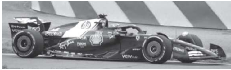
A Ferrari deixou a desejar com a faixa branca na tampa do motor que não caiu no agrado de seus fãs

Todos os grandes eventos esportivos globais promovem suas apresentações de gala na abertura de suas jornadas. É assim na Copa do Mundo de Futebol, nos Jogos Olímpicos, no Super Bowl dos Estados Unidos. Faltava a F1. Não falta mais. Porque na última terça-feira a Liberty Media, dona dos direitos comerciais da categoria promoveu uma mega festa de comemoração dos 75 anos da F1 realizada na O2 Arena, em Londres, com apresentação conjunta de todas as equipes, chefes, pilotos e a pintura definitiva de seus carros para a temporada 2025 que começa no dia 16 de março com o GP da Austrália, em Melbourne.