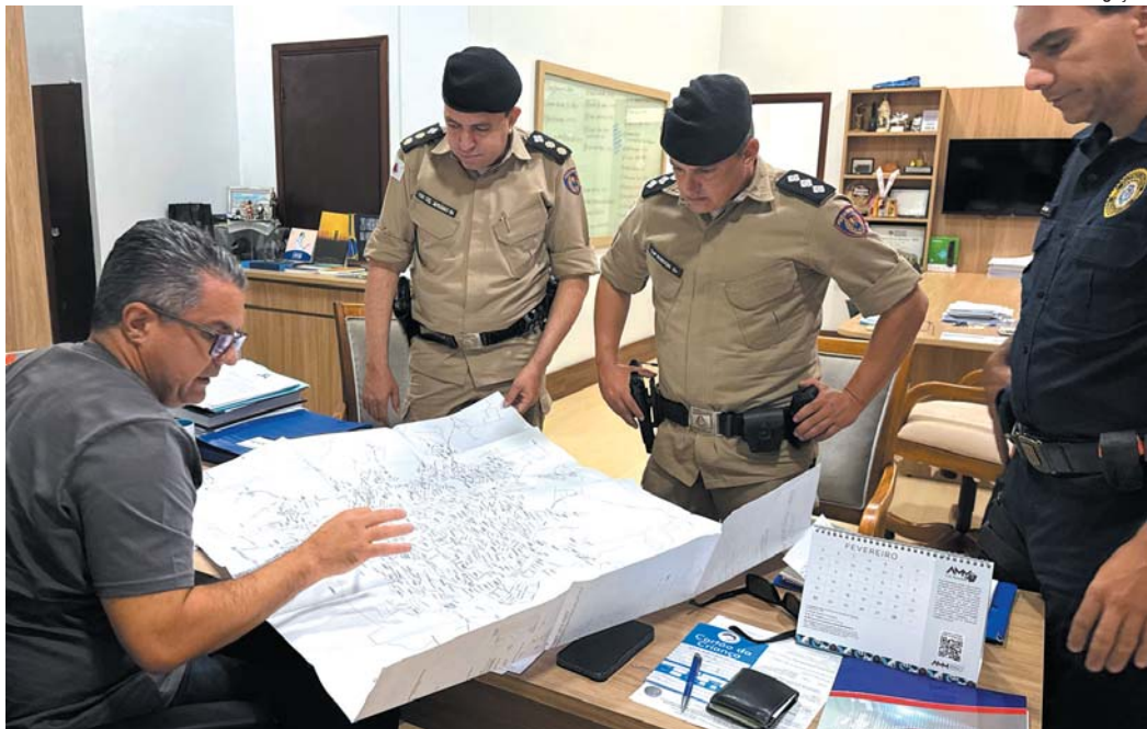
Processo licitatório será realizado no próximo dia 21 de março

Sicoob Nossocrédito reinaugura agência no bairro São Judas, em Paraíso