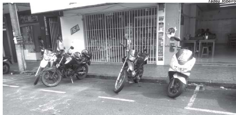
No centro de Paraíso, motos têm estacionado em área demarcada exclusivamente para carros