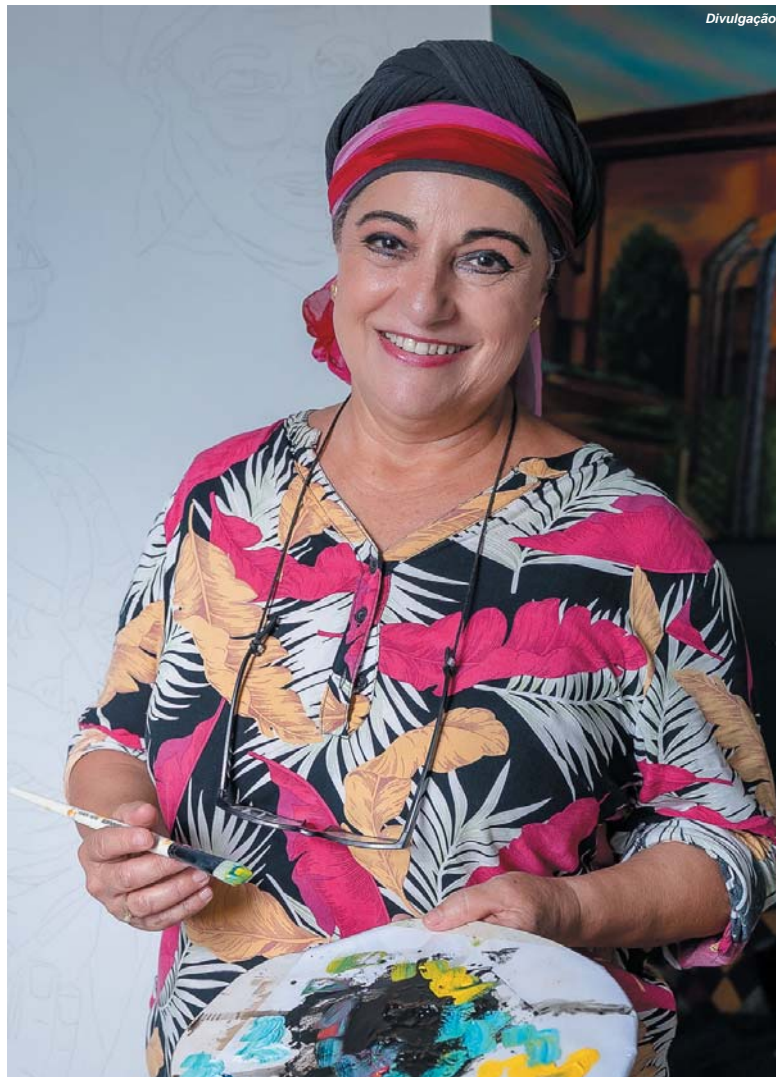
Artista Linah Biasi