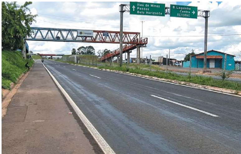
Rodovia BR 491, passarela Pe. Geraldo