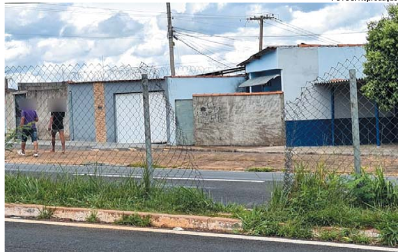
Tela de contenção do bairro João XVIII danificada