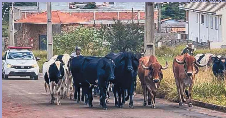
Ação ocorreu na manhã desta terça-feira próximo ao campus da UFLA; proprietário pagou multa de quase R$17 mil