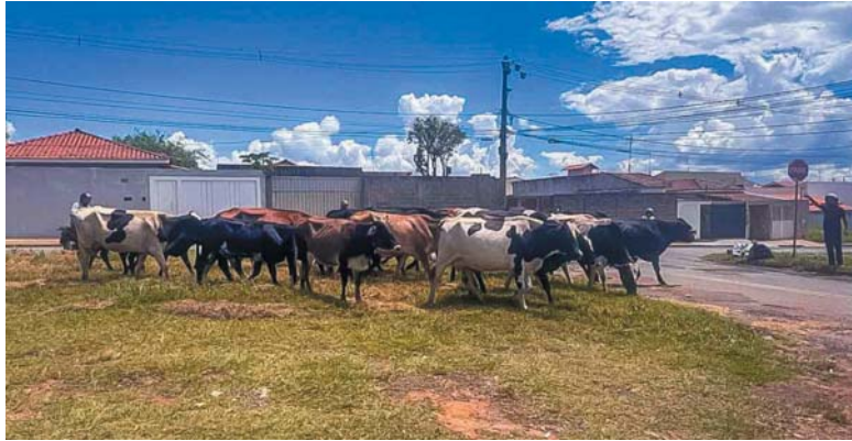
Por Ralph Diniz

Ação ocorreu na manhã desta terça-feira próximo ao campus da UFLA; proprietário pagou multa de quase R$17 mil