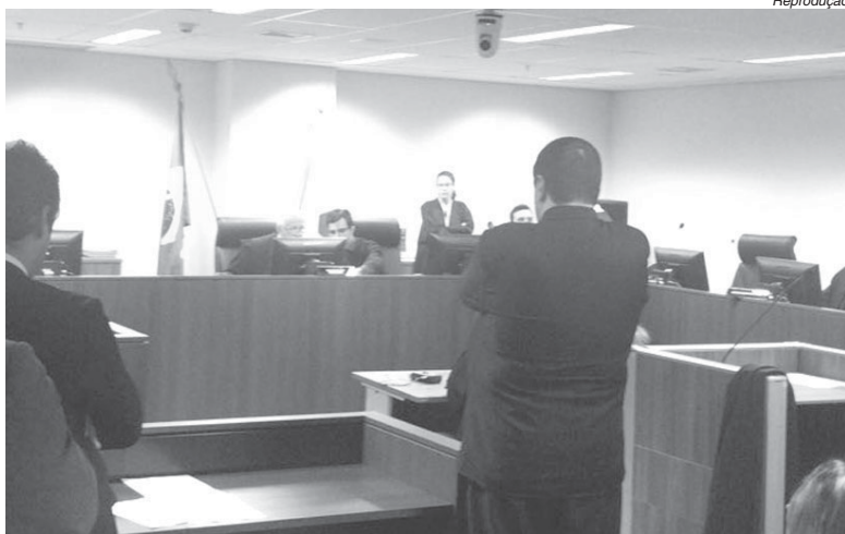
Audiência no Tribunal de Justiça foi realizada na tarde de quinta-feira, em Belo Horizonte

O ex-provedor já havia perdido o processo na comarca local e resolveu recorrer ao Tribunal de Justiça de Minas Gerais. Ele pedia a suspensão dos efeitos do Decreto Municipal que determinou a intervenção feita pelo prefeito Walker Américo Oliveira junto ao hospital, no dia 16 de de-