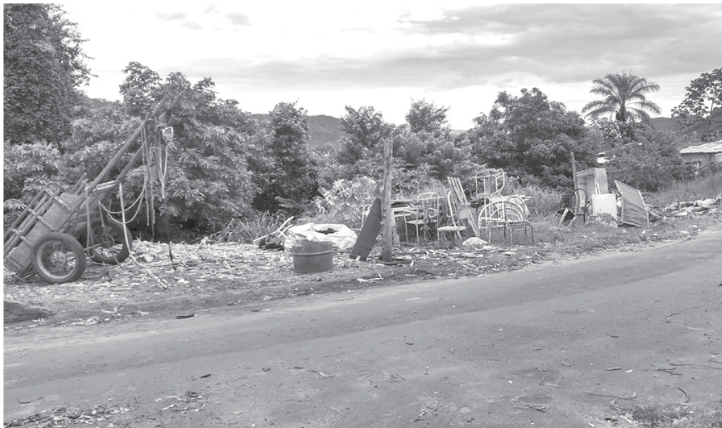
Área verde Municipal virou depósito de lixo, entulhos e outros detritos