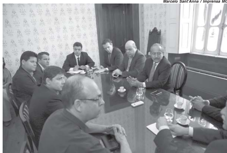
Equipe do governo reuniu-se com presidente da Associação dos Municípios Mineiros