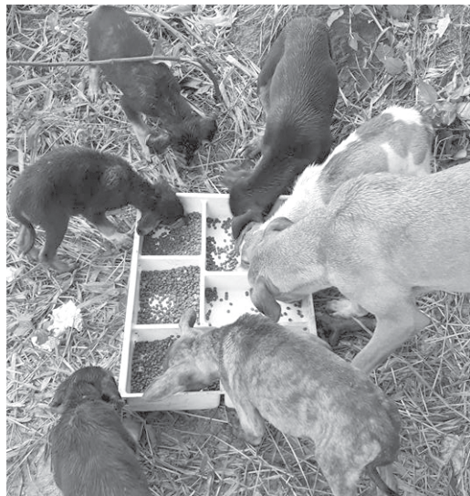
Vários cães abandonados estão aparecendo em diferentes regiões da cidade