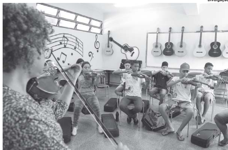
Alunos tem aula de cidadania e cultura como na visita ao Museu de Portinari

O currículo é constituído de duas partes – formação básica, que compreende as temáticas de cada área do conhecimento indicadas na Base Nacional Comum Curricular, e flexível, de acordo com três campos de integração: Cultura, Artes e Cidadania; Múltiplas Línguas; Comunicação e Novas Mídias e Pesquisa e Inovação Tecnológica.