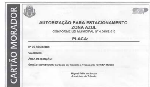
Documentos garantem aos idosos estacionar em vagas na mesma quadra onde mora sem pagar zona azul