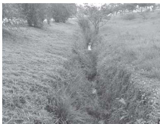
Dentro da canalização de água do córrego Coolapa, continua cheio de mato, detritos e até árvores nasceram e cresceram dentro do leito do córrego