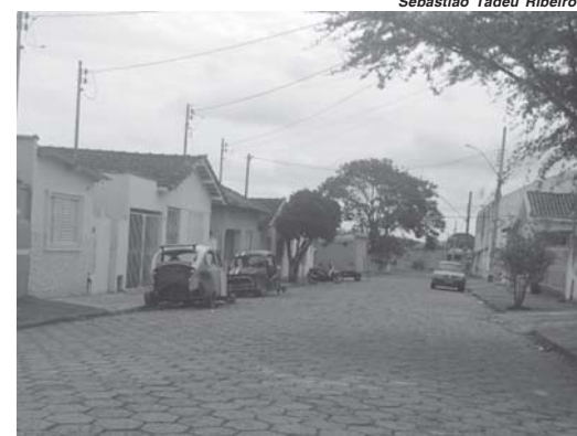
Carcaça de carros velhos abandonados continuam espalhados nos quatro cantos da cidade, inclusive estes dois que estão há anos estacionados na Rua 7 de Setembro na Vila Mariana