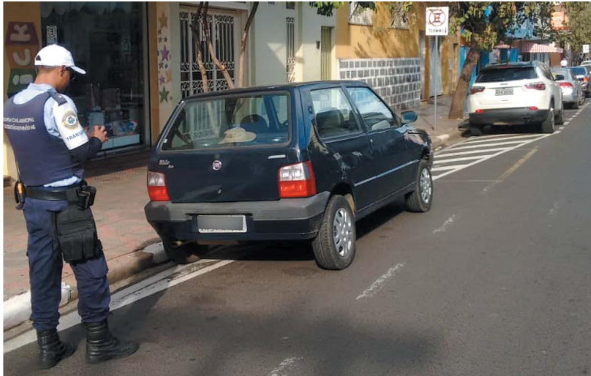
Jornal do Sudoeste

Homem tem perna dilacerada em picadeira de capim na região da Itaguaba