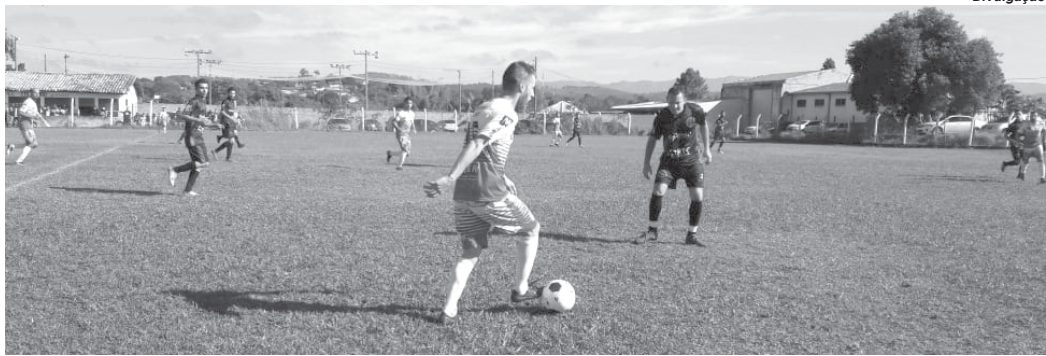
Torneio entre equipes da região de Paraíso ajudam a movimentar o futebol amador

Mais uma competição de futebol amador foi iniciada no domingo, 6, envolvendo equipes da região de São Sebastião do Paraíso. A rodada inaugural foi marcada pela realização das cinco primeiras partidas. Neste final de semana a organização divulgou que serão realizados mais três jogos envolvendo equipes titulares e aspirantes.