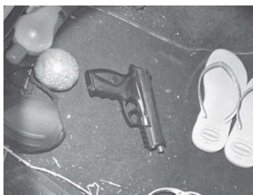
Vários objetos foram localizados e apreendidos no interior da Corolla, inclusive uma arma de fogo

Uma denúncia anônima levou a Polícia Militar a realizar uma tentativa de abordagem em dois veículos, com placas do interior paulista, que terminou em perseguição e fuga. Segundo informações, os criminosos haviam praticado um sequestro relâmpago a um casal em uma estrada vicinal, em Santo Antônio da Alegria (SP). As vítimas foram abandonadas na rodovia BR-491 e a polícia ainda conseguiu localizar um dos automóveis também abandonado juntamente com uma pistola e outros objetos.