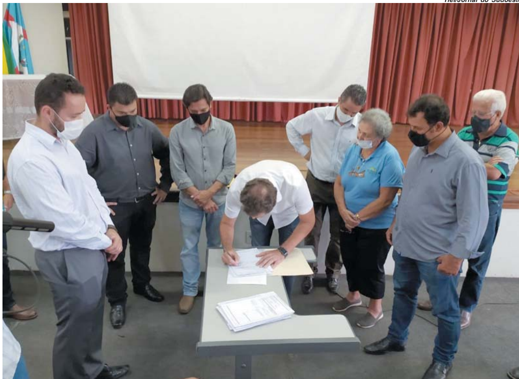
Tiel/Jornal do Sudoeste