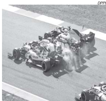
Vinte anos de coluna Pole Position contando o que de mais importante acontece no automobilismo