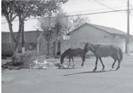
Neste Final de Semana, Cavalos estavam soltos perambulando na Av. Maestro Joaquim Souto, no Rosentina