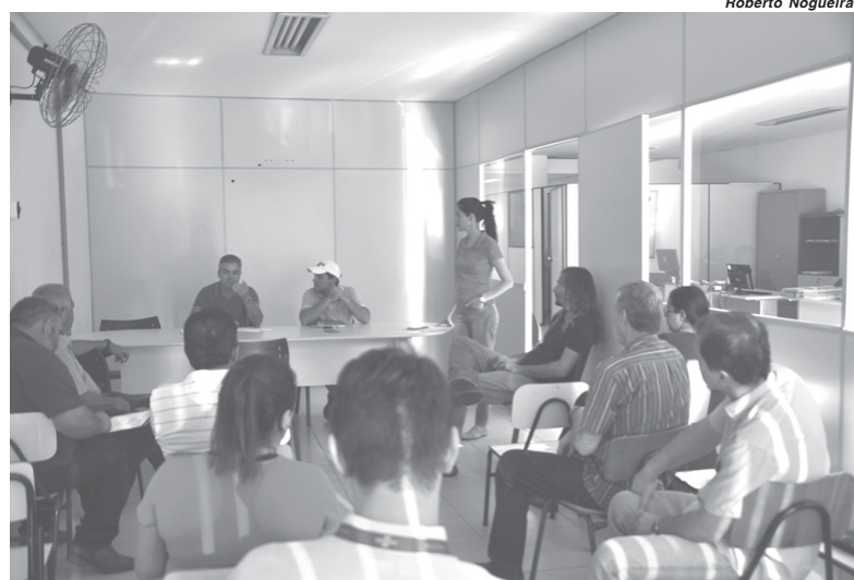
Reunião do Conselho de Desenvolvimento Rural Sustentável acontece na segunda quarta-feira de cada mês na Sedeagro

Outro trabalho a ser desenvolvido refere-se a coleta e embalagem de agrotóxicos. A iniciativa abrangerá os bairros