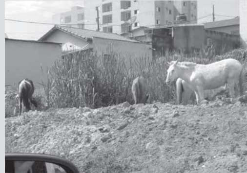
Cavalos soltos pastando em um terreno vago na Av. Dep. Delson Scarano, bem próximo do Centro de Paraíso