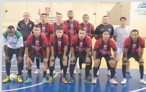
Curtume Bela Vista