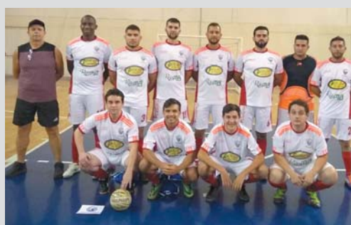
Santa Casa de Misericórdia

A Associação Comercial, Industrial, Agropecuária e de Serviços de São Sebastião do Paraíso (Acissp), deu início na terça-feira (11/9), a mais uma edição da Copa do Comércio e Indústria de Futsal Acissp. O evento já é tradicional entre os atletas do futsal em Paraíso, e, principalmente, entre os trabalhadores das empresas associadas à ACISSP.