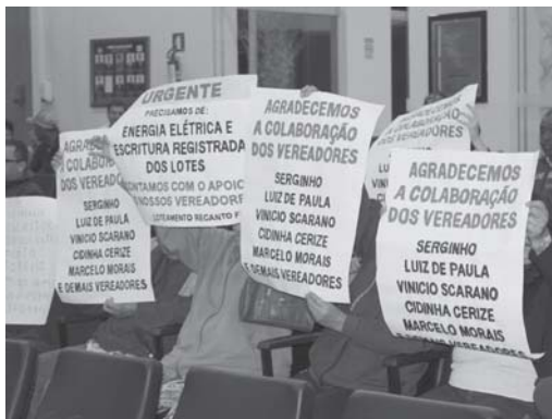
Já se passou um ano, dois meses e vinte dias, que dezenas de proprietários de imóveis no Loteamento Rural Recanto Feliz estiveram na Câmara Municipal pedindo ajuda