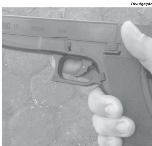
Simulacro de pistola utilizada em assalto foi apreendida e autor foi preso