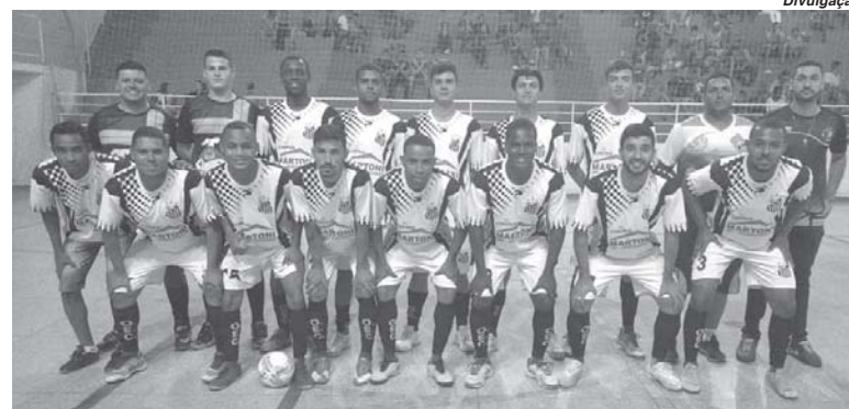
Jovem equipe de Paraíso reúne atletas de uma nova geração do futebol de salão da cidade

A estreia de São Sebastião do Paraíso na competição ocorreu na terça-feira, 10, em Alpinópolis. A rodada dupla começou com a goleada