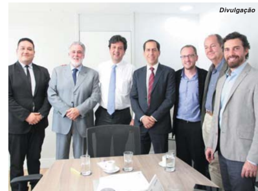
No Ministério da Saúde dirigentes da Santa Casa apresentaram reivindicações de melhorias na prestação de serviços

O ministro da Saúde, Luiz Henrique Mandetta, recebeu em audiência na tarde de quinta-feira (12/9), dirigentes da Santa Casa de Misericórdia de São Sebastião do Paraíso. A instituição, que está prestes a completar 102 anos de existência, busca o apoio das mais diversas forças públicas e privadas, em um processo de reestruturação e de modernização de sua gestão. O presidente da comissão de intervenção do hospital, o empresário Fernando Montans Alvarenga apresentou uma pauta de reivindicação ao ministro.