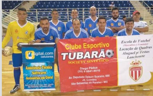
Alpinia Veículos - Digital.com - Tubarão