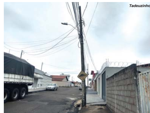
Postes bastante inclinados na Rua Portugal, Jd. Europa, preocupam moradores e transeuntes.

Outra reclamação de moradores e pedestres é que na Rua Portugal, nas proximidades da farmácia, a luz do poste está queimada e já se faz um bom tempo. O local só não está mais escuro devido luminárias externas da frente da farmácia estarem acesas durante à noite, afirmou um dos proprietários da farmácia ao JS. Pedem providências por parte da Cemig e Prefeitura.