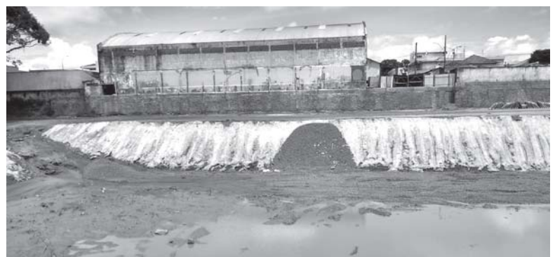
Onde era a piscina da Praça de Esportes Castelo Branco e também como está em total abandono o Centro Social Urbano 1

Segundo engenheiro do DER-MG, obra na entrada de uma estrada vicinal causou o problema de acúmulo de água. Reparo já foi solicitado