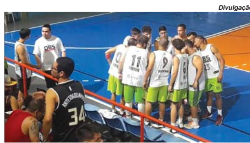
Jogadores e torcida têm demonstrado entusiasmo com retorno das competições de basquete a Paraíso

Nesta semana, foram realizadas duas últimas rodadas da primeira fase da competição. Pela quinta etapa, o Paradise Origins venceu o OBS Team por 58 a 28; os Vingadores derrotaram o Veteranos Clube Paraisense por 84 a 32, e o Kadett95 não tomou conhecimento do Quintal Basketball e fechou o placar em 101 a 49. Já pela etapa derradeira, os Vingadores também castigaram o Quintal, por 83 a 18; o Paradise Origins bateu os Veteranos por 69 a 56,