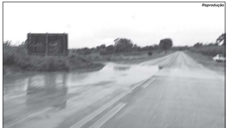
Segundo engenheiro do DER-MG, obra na entrada de uma estrada vicinal causou o problema de acúmulo de água. Reparo já foi solicitado

Trechos da via que liga Paraíso a São Tomás estão com problemas de escoamento de águas da chuva. Vereador aponta risco de acidentes