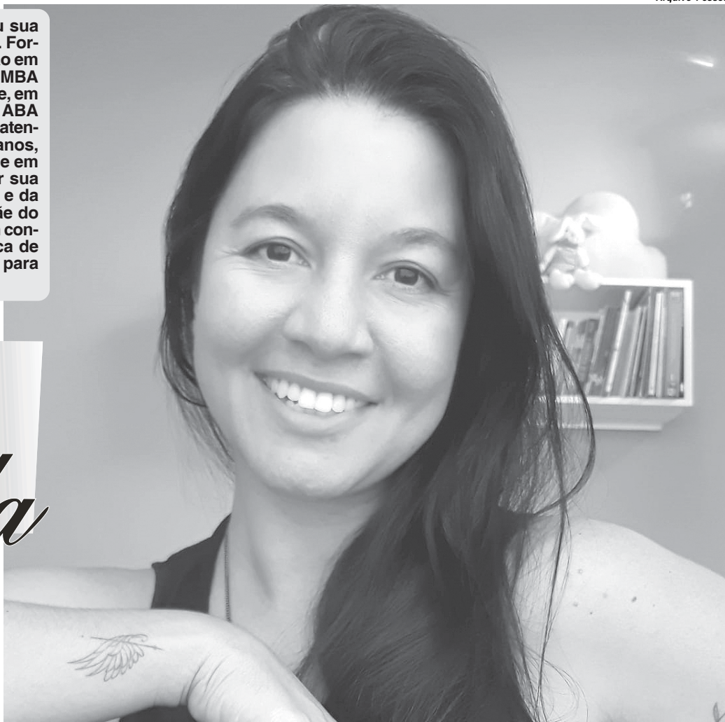
Any é psicóloga e atualmente atende em consultório particular e também presta serviços para o Hospital Gedor Silveira

Jornal do Sudoeste: Quais as memórias mais marcantes você guarda da sua infância em Paraíso?