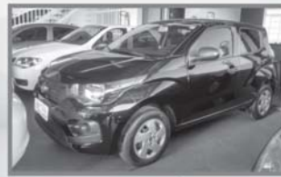
MOBI EASY ON - PRETO - 2017 - DIREÇÃO E AR CONDICIONADO