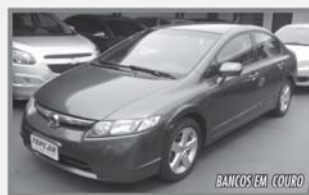
CIVIC FLEX - 2008 - COMPLETO - AUTOMÁTICO - CINZA