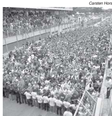
Invasão de pista do ótimo público de Interlagos para ver de perto a cerimônia de pôdio que teve até escola de samba com passistas

Tomo a liberdade de usar uma frase da colega 'Alessandra Alves', comentarista do 'Grupo Bandeirantes de Rádio', que transmite todas as etapas do Mundial: "Pista velha é que faz corrida boa"! É uma grande verdade. Nem precisou da chuva que rondou Interlagos desde os treinos da sexta-feira para fazer do GP do Brasil uma das melhores corridas da temporada. O mesmo Verstappen que deu show de ultrapassagens e caminhava para uma surpreendente e merecida vitória, desbancando