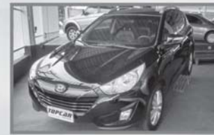
IC35 - 2011 - AUTOMÁTICO - COMPLETO - PRETO