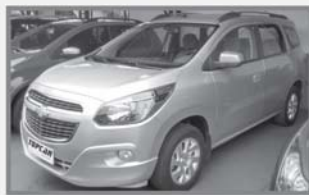
SPIN LTZ - 2016 - CÂMBIO MANUAL - COMPLETA - PRATA