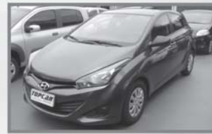
HB 20 COMFORT PLUS 1.0 - 2013 - COMPLETO - CINZA