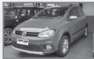
CROSSFOX 1.6 - 2014 - COMPLETO - VERMELHO