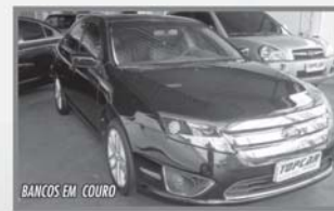
FUSION SEL - 2011 - COMPLETO - AUTOMÁTICO - PRETO