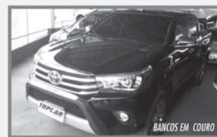
HILUX SRX 4x4 - 2017 - DIESEL - PRETA - AUTOMÁTICA - COMPLETA