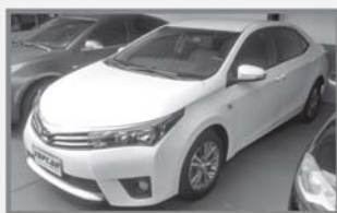
COROLLA XEi - 2015 - AUTOMÁTICO - COMPLETO + COURO - BRANCO