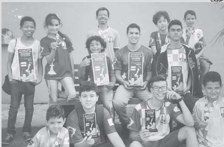
Delegação de São Sebastião do Paraíso no Torneio de Xadrez de Capitólio

Aconteceu no dia 11/11 a 10ª Etapa do 2º Circuito Regional de Xadrez 2018, que foi realizada turística cidade de Capitólio/MG. O evento é organizado pelo árbitro internacional Olyntho Meirelles e tem como árbitro auxiliar o paraense Lázaro dos Reis de Paschoa.