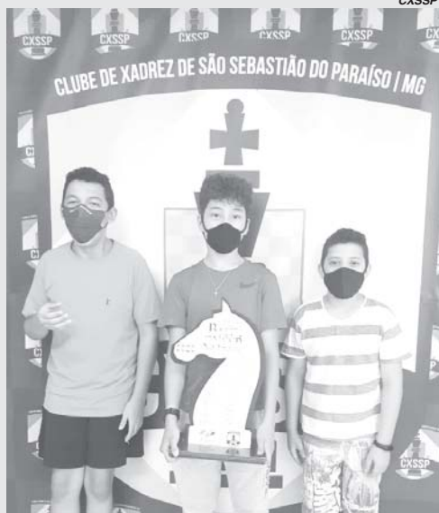
aPremiação da etapa 31

Foi realizada, dia 08.09.2021, a trigésima primeira etapa do circuito blitz 2021 série B do Clube de Xadrez de São Sebastião do Paraíso - CXSSP.