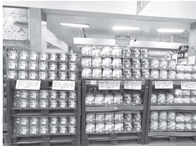
Loja Tonin de Ribeirão Preto disponibiliza diversas opções de panetones

Ainda de acordo com ele, a demanda por panetones sempre foi alta nos períodos sazonais mas, mesmo fora de época,