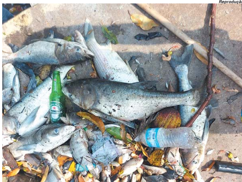
Milhares de peixes foram retirados da Lagoinha após chuva ácida

Na sexta-feira,9, a Lagoinha amanheceu poluída com as águas pretas e cheirando a queimado em função da grande quantidade de água tóxica que havia caído da chuva do dia anterior. Bombas aeróbicas foram ligadas para tentar oxigenar o ambiente e com o passar das horas os primeiros exemplares de peixes já apareciam mortos no local. De acordo com o prefeito