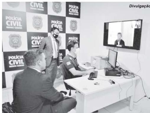
Medida garante agilidade nos procedimentos policiais e economia para o Estado

O Plantão Digital é uma iniciativa da Polícia Civil de Minas Gerais (PCMG), tem o propósito de facilitar o acesso da população à segurança pública, proporcionando mais prevenção e, como consequência, menos impunidade e mais investigação e apuração de crimes. Testado em caráter expe-