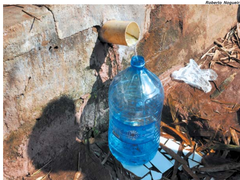
Diversas pessoas foram buscar água nas minas, dizendo que estava melhor do que a ofertada quando tinha

Para piorar nos poucos locais em que se encontrava um galão de água os preços foram aumentados e muita gente desistiu de comprar por não