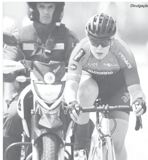
Ciclista paraisense comemorou primeiro lugar no pódio no empate com atleta de Ana Júlia de Rolândia

As categorias Elite, Sub 23 e Master Open, todas masculinas, percorreram todas as cidades da região, vetado pelo Departamento de Estrada de Rodagem (DER) para esta edição. A prova, válida pelo Ran-