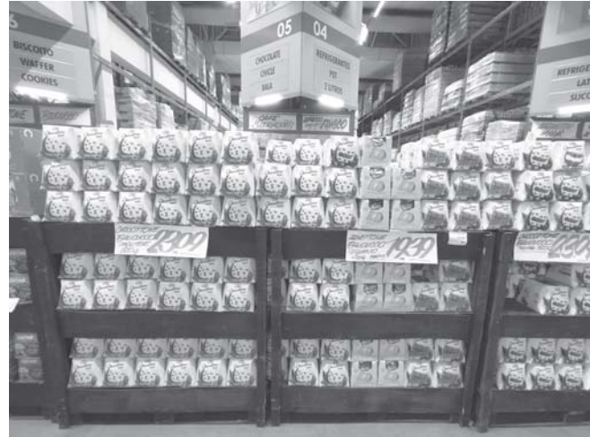
Panetones disponíveis na loja Tonin de Ribeirão Preto

ca, a aceitação é enorme. "Conforme os clientes têm conhecimento da oferta dos panetones, a procura aumenta gradativamente. A partir de outubro é que temos um aumento real na busca pelo produto", diz Tonin.